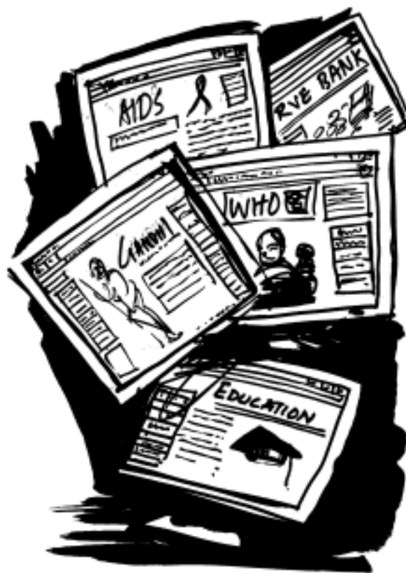
चित्र : 21.3: वेबसाइट

भारत जैसे देश में जहाँ आज भी गाँवों की संख्या अधिक है कितने लोगों की पहुँच कम्प्यूटर तक है? और अगर लोग कम्प्यूटर का उपयोग नहीं जानते तो न्यू मीडिया की उपयोगिता क्या होगी?