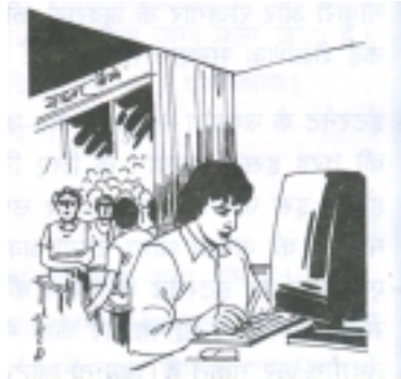
चित्र 35.3: साइबर क़ेफ़े पर इंटरनेट का उपयोग

इंटरनेट का अर्थ है कंप्यूटरों का जाल। यह जाल स्थानीय स्तर पर भी तैयार किया जा सकता है और राष्ट्रीय अंतर्राष्ट्रीय स्तर पर भी। जब कई कंप्यूटरों को सर्वर के ज़रिए जोड़ दिया जाता है तो वे एक जैसे वातावरण में काम करने लगते हैं। इसी तरह जब इन्हें उपग्रह के ज़रिए जोड़ दिया जाता है तो दुनिया भर में कंप्यूटरों का एक जाल तैयार हो जाता है। इंटरनेट सर्वर के ज़रिए जुड़े कंप्यूटरों से कई मायनों में भिन्न होता है। इंटरनेट में कार्यक्रम तैयार कर लिखित या चित्र रूप में टेलीविज़न की तरह प्रसारित किए जाते हैं। जिस तरह आप अलग-अलग चैनल बदल कर टेलीविज़न के अलग-अलग कार्यक्रम देख सकते हैं, उसी तरह इंटरनेट पर साइट लॉग ऑन करके अपनी मनचाही सूचनाएँ इकट्ठी कर सकते हैं। इस तरह इंटरनेट एक प्रकार की समृद्ध लाइब्रेरी है। जिस तरह लाइब्रेरी से मनचाही पुस्तक निकाल कर पढ़ी जा सकती है उसी तरह इंटरनेट की अलग-अलग साइटों से जानकारियाँ हासिल की जा सकती हैं। अगर आपको यह जानकारी नहीं है कि किस विषय पर जानकारी कहाँ, किस साइट पर मिलेगी तो आप सर्च इंजन में अपना विषय टाइप कर इसकी जानकारी प्राप्त कर सकते हैं।