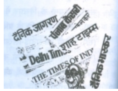
चित्र 35.1: तरह-तरह के अखबार

अखबार चूँकि हर दिन प्रकाशित होते हैं इसलिए इनमें रोज़ की विभिन्न क्षेत्रों की ताजा खबरें प्रमुखता से प्रकाशित होती हैं। इसलिए इन्हें समाचार पत्र कहा जाता है। दुनिया भर में चूँकि हर क्षेत्र में हर पल कोई-न-कोई नई घटना घटती है और उनमें से हर क्षेत्र की जानकारी हर कोई पाना चाहता है इसलिए हर अखबार अपने-अपने तरीके से खबरों के लिए अलग-अलग पन्ने निर्धारित करता है। आपने अखबार पढ़ते हुए देखा होगा कि आमतौर पर पहले पन्ने पर देश-दुनिया की सबसे महत्वपूर्ण खबरें प्रकाशित होती हैं, जैसे प्रधानमंत्री की किसी योजना की घोषणा, कोई महत्वपूर्ण फैसला या दुनिया के किसी देश में हुई कोई बहुत महत्वपूर्ण राजनीतिक घटना। इसी तरह ज़्यादातर अखबारों में आखिरी पन्ने पर खेल, दूसरे पन्ने पर स्थानीय खबरें और आखिर के दूसरे पन्ने पर अर्थ जगत से जुड़ी खबरें होती हैं। इसके अलावा देश-विदेश की खबरों के लिए अलग से पन्ने निर्धारित किए जाते हैं और संपादकीय के लिए आमतौर पर बीच का पन्ना निश्चित होता है।