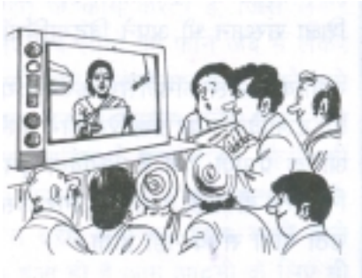
चित्र 35.2: दूरदर्शन अधिक रोचक

लगती हैं, आपके मन पर ज़्यादा समय तक अंकित रहती हैं कि इसमें श्रव्य के साथ-साथ विजुअल यानी दृश्य सामग्री भी होती है। कई बार आपने महसूस किया होगा कि जिन बातों को पढ़ या सुन कर आप नहीं समझ पाते उन्हें देख कर आसानी से समझ जाते हैं और वह आपको लंबे समय तक याद भी रहती है। कई बार लिखकर या बोलकर जिन बातों को समझा पाना या अभिव्यक्त कर पाना मुश्किल होता है