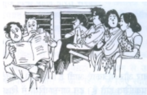
चित्र 35.2: अखबारों की उपयोगिता

सबसे पहले वही पृष्ठ खोल कर पढ़ते हैं। इसी तरह अगर आपके किसी मित्र को खेल में रुचि है तो वह खेल का पन्ना खोलता है और उसे खेल से जुड़ी सारी खबरें एक जगह मिल जाती हैं। इस तरह पूरे अखबार में से अपनी रुचि के समाचार छँटना आसान हो जाता है। वैसे ही अगर आप विद्यार्थी हैं और आपको पता है कि आपके अखबार में सप्ताह में एक दिन सेहत, डाक्टर की सलाह, किशोर शिक्षा,