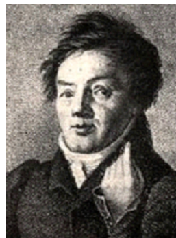
जे. डब्ल्यू. डॉबेरीनर (1780-1849)

1829 में जे. डब्ल्यू. डॉबेरीनर एक जर्मन रसायतिज्ञ ने तीन तत्वों का एक समूह बनाया और उसे ट्रायड (सारणी 6.1) का नाम दिया। ट्रायड के तीनों तत्वों के गुण एक समान थे उन्होंने एक नियम जिसे 'डॉबेरीनर का त्रिक या ट्रायड नियम' का प्रस्ताव दिया। इस नियम के अनुसार जब तत्वों को उनके बढ़ते परमाणु द्रव्यमान के क्रम में व्यवस्थित करते हैं तो बीच के परमाणु का द्रव्यमान पहले और तीसरे तत्व के परमाणु द्रव्यमान के गणितीय औसत के बराबर था और उसके गुण भी उन दोनों के मध्यवर्ती थे।