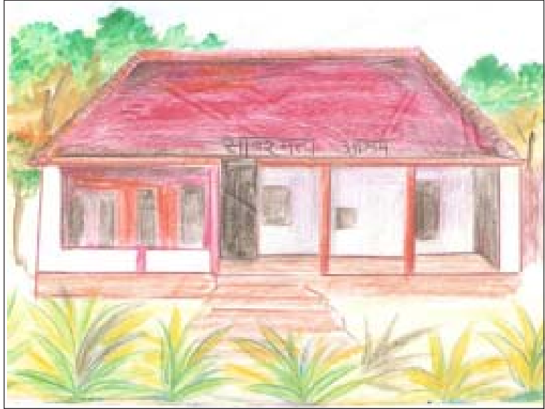
चित्र 20.5: अहमदाबाद (गुजरात) में साबरनदी तट पर स्थित सत्याग्रह आश्रम

भावार्थः महात्मा गाँधी आँग्लशासनस्य विरोधे सत्याग्रहं कर्तुम् उद्यतः अभवत्। एतदर्थं सः स्व-अनुयायिभिः सह सबर्मत्याः तटे सत्याग्रहाश्रमं स्थापितवान्।