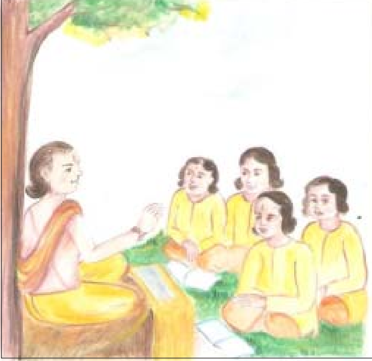
चित्र 17.1: विद्यार्थियों को वेदों के मंत्रों का उच्चारण तथा अध्ययन कराते हुए शिक्षक