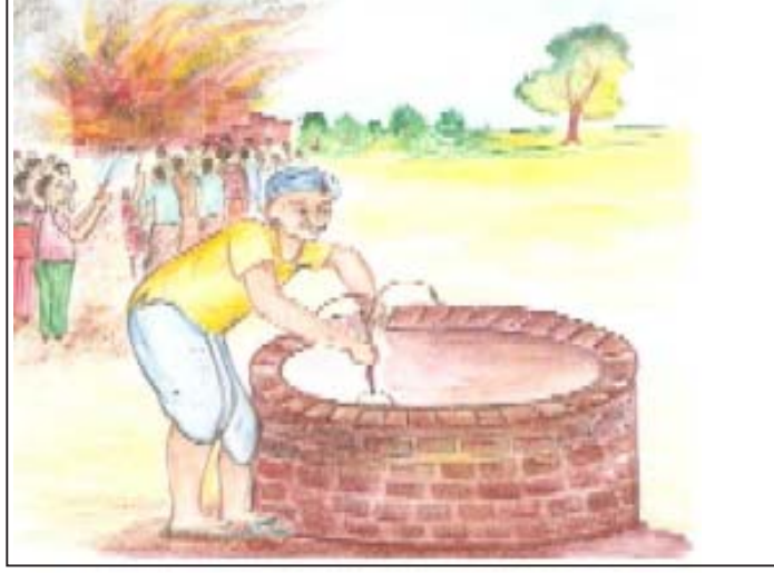
चित्र 6.1: आग लगने पर कुँए से पानी ले जाकर आग बुझाते हुए