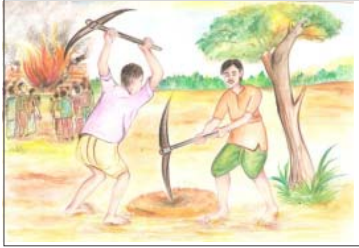
चित्र 6.2: आग लगने पर कुँआ खोदते हुए