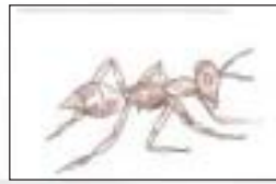
चींटी का चित्र