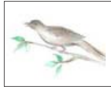
कोयल का चित्र