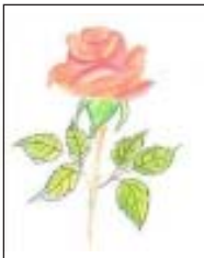
गुलाब का चित्र