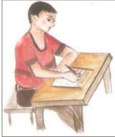
चित्र 22.2: पत्र लिखते हुए

यद्यपि सभी पत्र एक-दूसरे से अलग होते हुए भी प्रारूप/लेखन के प्रकार में कुछ समानताएँ व विभिन्नताएँ लिए रहते हैं, इन्हें जान लेने पर पत्र लेखन में पर्याप्त सरलता और एकरूपता आ जाती है। इसलिए पहले इनके सामान्य प्रारूप पर विचार किया जा रहा है। पत्र प्रारूप के विभिन्न अंग होते हैं-