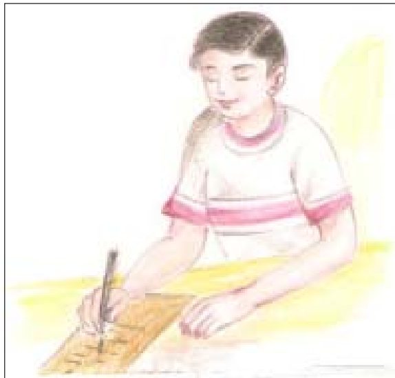
चित्र 22.1: अपने आत्मीय जन को पत्र लिखते हुए बालक

मनुष्य एक सामाजिक प्राणी है। उसे अपने भावों, विचारों के आदान-प्रदान की आवश्यकता होती है। इसके बिना वह जीवित नहीं रह सकता। जो समीप होते हैं उनसे हम वार्तालाप द्वारा अपने विचारों का आदान-प्रदान करते हैं। हमारे सभी आत्मीय सर्वदा हमारे समीप ही वर्तमान नहीं रहते हैं। अतः दूर स्थित स्वकीय लोगों के साथ विचार विनिमय का जो सर्वसुलभ साधन है, वह है 'पत्र'। आज जबकि दूर संचार टेलीफोन, मोबाइल, इंटरनेट (ईमेल) तथा फेसबुक एवं आरकुट जैसी सोशल नैटवर्किंग साइट्स आदि ने यद्यपि स्थान की दूरियों को कम कर दिया है, तब भी पत्रों का महत्त्व कम नहीं हुआ है। ये पत्र-व्यवहार हमारे मित्रों, कार्यालयों अथवा संस्थाओं आदि के साथ भी हो सकता है। कुशलवार्ता निवेदन, अनुराग प्रकट करना, धनादि की अभ्यर्थना, सूचना प्रदान करना, प्रशंसा करना तथा व्यवहार का आदान-प्रदान करना इस प्रकार असंख्य व्यवहार पत्र द्वारा किये जाते हैं। हमारे जीवन में अनेक ऐसे अवसर आते हैं जब हमारे भावों की अभिव्यक्ति हमेशा एक जैसी नहीं होती और हम व्यक्ति एवं अवसर के अनुरूप अपनी भावनाओं को अलग-अलग शब्दों में व्यक्त करते हैं।