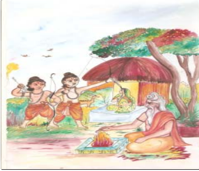
चित्र 21.1: चित्रं दृष्ट्वा अधस्तात् दत्तं संवादं पूरयत।