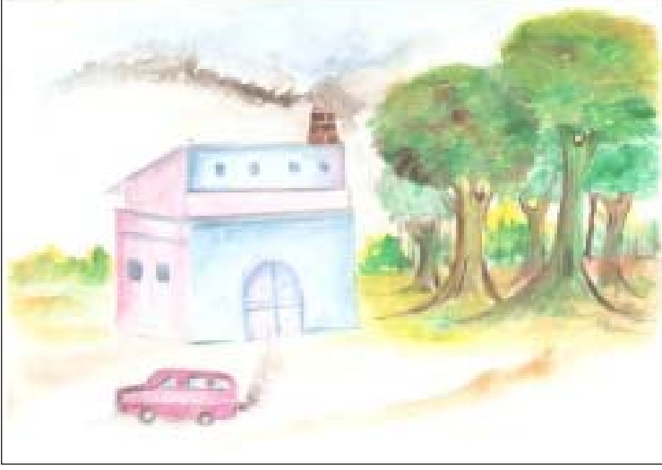
चित्र 19.1: उद्योगों तथा मोटरगाडियों से निकले धुँआ से पर्यावरण प्रदूषण

चित्रम् दृष्ट्वा निम्नलिखितानां प्रश्नानाम् उत्तराणि लेख्यानि