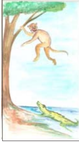
चित्र 3.1: वानर एवं मगरमच्छ