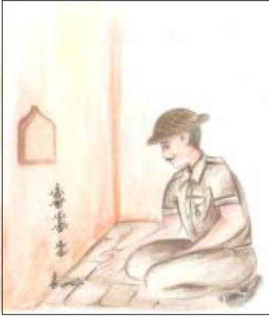
चित्र 2.1: चींटीयों को गिरते हुए देखता सैनिक