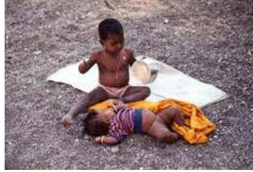
चित्र 10.3: निचले एसईएस से बच्चे

परिवार, साथी, संचार माध्यम और विद्यालय के अतिरिक्त भी कुछ दूसरे कारक हैं जो सामाजीकरण की प्रक्रिया पर प्रभाव डालते हैं। माता-पिता की सामाजिक-आर्थिक स्थिति और कुल परम्परा बच्चों के विकास में प्रत्यक्ष और अप्रत्यक्ष रूप से असर डालते हैं। कुल परम्परा (एथनीसिटी), परिवार के आकार, संरचना, शिक्षा, आय, रचना और फैले हुए जाल से जुड़ी होती है।