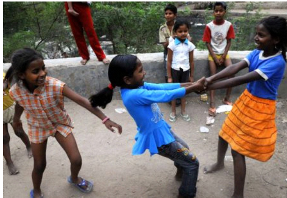
चित्र 10.2 : खेलते हुए लड़कियाँ

इस मध्य बाल्यकाल में लिंग परिवर्तन भी देखा जाता है। लड़कियाँ पारस्परिक और पारिवारिक सम्बन्धों को अधिक महत्व देती हैं जबकि लड़के सामाजिक प्रतिष्ठा पर अधिक बल देते हैं। इस आयु के बच्चों में कमजोरों को तंग करना या धमकाना प्रचलित समस्या है। शोधकर्ताओं के अनुसार तंग करने वाले बच्चे कतिपय ये विशेषताएं प्रदर्शित करते हैं जैसे कहीं भी अनधिकार प्रवेश करना, प्रतिक्रियाहीन माता-पिता के सामने अपनी मांगे रखना। पीड़ित बच्चे बहुधा अवसादग्रस्त होते हैं और उनमें आत्मसम्मान कम होता है।