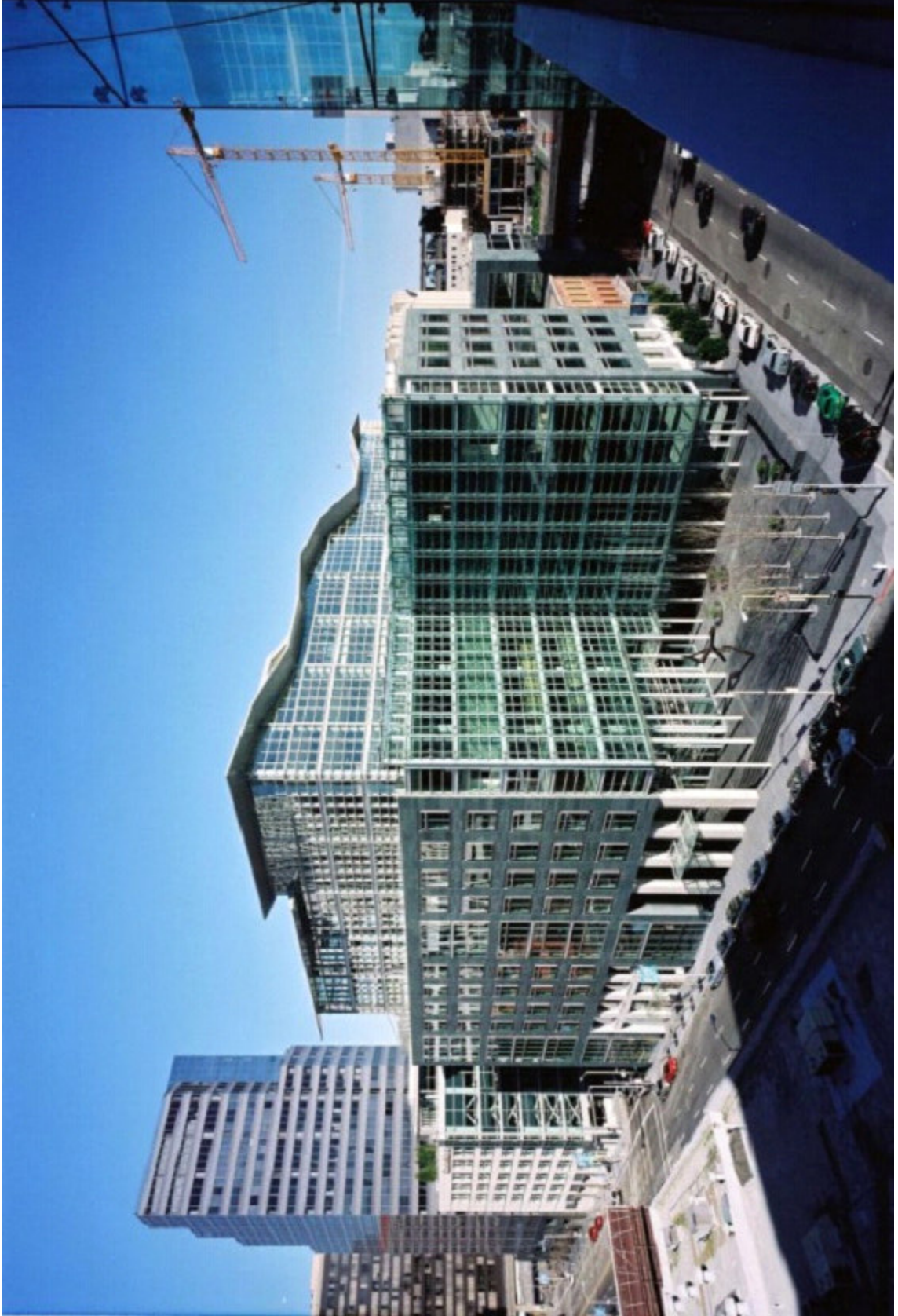
चित्र 2.4: भवन का वास्तविक व्यू