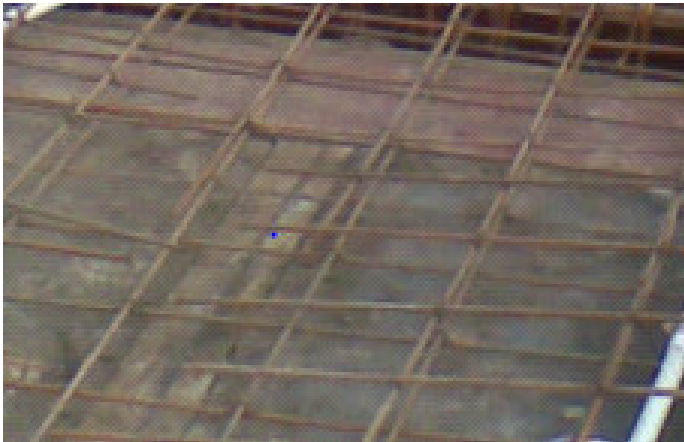
चित्र 2.5: सरिये का मानचित्र