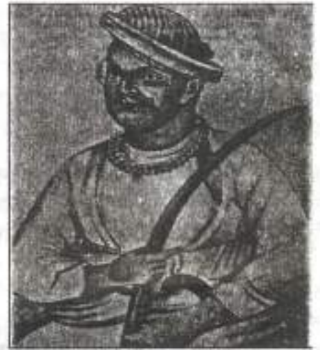
चित्र 19.4 नाना साहेब