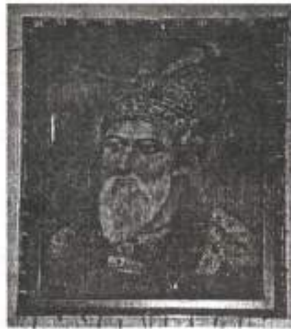
चित्र 19.1 स्वतंत्रता सेनानी, बहादुर शाह (द्वितीय) जफर, अंतिम मुगल सम्राट

प्रारंभिक उपद्रव मार्च, 1857 में उस समय प्रारंभ हुआ, जब कलकत्ता के निकट बैरकपुर में मंगल पांडे नामक सिपाही ने अन्य सिपाहियों को ब्रिटिश सेना अधिकारियों के खिलाफ