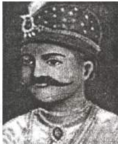
चित्र 19.3 तांत्या टोपे