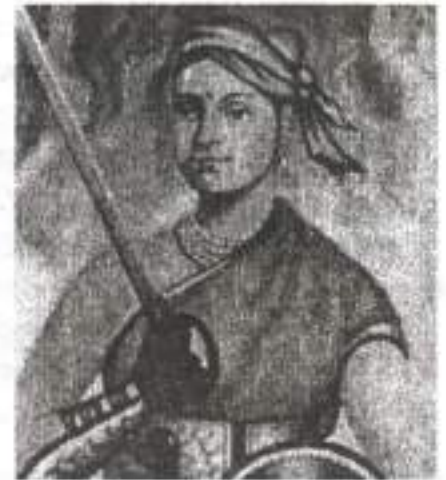
चित्र 19.2 झांसी की रानी लक्ष्मी बाई, स्वतंत्रता सेनानी