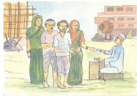
चित्र 17.1 सामाजिक तथा आर्थिक असमानताएँ