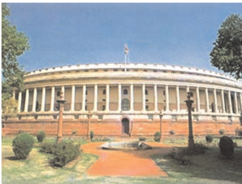
चित्र 15.2 भारत की संसद