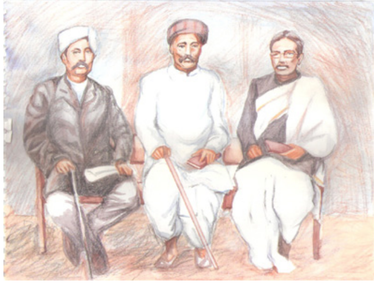
चित्र 8.2 लाल-बाल-पाल

गरमदल का यह विश्वास था कि अंग्रेज भारतीयों का शोषण करते हैं, उसकी आत्म-प्रचूरता को नष्ट करते हैं और भारत का धन ले जाते हैं। वे अनुभव करते थे कि अब भारतीयों को खुद सरकार चलानी चाहिए। ये गरमपंथी गुट सरकार को दरखास्त करने के बदले बड़े पैमाने पर विरोध करने, सरकार की नीतियों की आलोचना करने, विदेशी वस्तुओं का बहिष्कार करने, स्वदेशी (गृह-निर्मित) वस्तुओं का उपयोग करने आदि में विश्वास करते थे। वे स्वतंत्रता के लिए सरकार की दया पर निर्भर नहीं थे लेकिन वे यह विश्वास करते थे कि यह उसका अधिकार है। बाल गंगाधर तिलक ने नारा दिया “आजादी मेरा जन्म सिद्ध अधिकार है और हम इसे लेकर रहेंगे।” 1916 में दोनों समूह पुनः एनी बेसेन्ट के प्रयास से एक हुए। क्या आपको उनके बारे में याद है जो आप पहले के अध्याय में पढ़ चुके हैं? उन्होंने 1914 में होमरूल आन्दोलन के लिए काम करना शुरू किया। उनके द्वारा बताया गया कि भारत को स्वशासन दिया जाना चाहिए। 1916 में मुस्लिम लीग और कांग्रेस भी वैचारिक तौर पर परस्पर नजदीक आए और लखनऊ एक्ट पर हस्ताक्षर किए। बाद में महात्मा गाँधी, जवाहर लाल नेहरू सुभाष चन्द्र बोस भारतीय राष्ट्रीय कांग्रेस के प्रसिद्ध चेहरे हुए जिन्होंने स्वतंत्रता संघर्ष को आगे बढ़ाया।