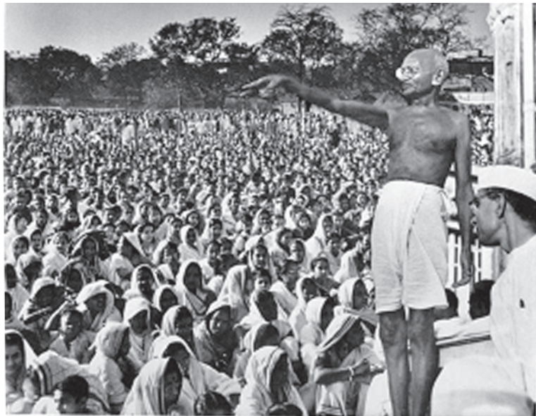
चित्र 8.4: महात्मा गांधी राष्ट्रीय आंदोलन के दौरान

उस समय तक, गाँधीजी समझते थे कि सरकार को समर्थन देकर कोई उपयोगी काम नहीं हो सकता। बीती घटनाओं के प्रकाश में और ब्रितानी सरकार के कार्य के बाद, उन्होंने सरकार के सामने कुछ मांगें रखीं। जैसे, सरकार को अमृतसर की घटनाओं पर पछतावा व्यक्त करना चाहिए, इसे तुर्की के प्रति उदार प्रवृत्ति दर्शानी चाहिए और भारतीयों की संतुष्टि के लिए सुधार की नई योजनाएँ प्रारंभ करनी चाहिए। यदि सरकार उनके माँगों को स्वीकार में असफल हुईं उन्होंने असहयोग आंदोलन प्रारंभ करने की धमकी दी। सरकार ने इस पर कोई ध्यान नहीं दिया। इस प्रकार गाँधी ने अपना असहयोग आंदोलन अगस्त 1920 में प्रारंभ किया जिसमें उन्होंने लोगों से ब्रितानी सरकार का साथ न देने की अपील की। इसी समय, मुस्लिमों के द्वारा प्रारंभ खिलाफत आंदोलन और गाँधी के नेतृत्व में असहयोग आंदोलन मिलकर ब्रिटिश सरकार के खिलाफ एक मोर्चा बना। इसके लिए गाँधीजी ने एक विस्तृत कार्यक्रम तय किया (1) पदवी तथा सम्मान लौटाना, कार्यालय तथा स्थानीय निकाय के पदों से त्यागपत्र। (2) कार्यालय और गैर कार्यालय के कार्यों में उपस्थित होने से इनकार। (3) सरकार के द्वारा संचालित विद्यालयों तथा कॉलेजों से धीरे-धीरे छात्रों को हटाना। (4) वकीलों के द्वारा ब्रिटिश न्यायालय का बहिष्कार आदि। (5) सैनिक, लिपिक तथा मजदुर वर्गों की सेवा की नियुक्ति का इनकार (6) विधानसभा के चुनाव में प्रत्याशी तथा मतदाताओं का बहिष्कार (7) विदेशी सामानों का बहिष्कार