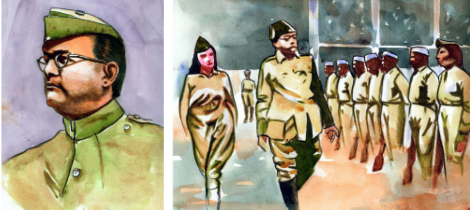
चित्र 8.7: सुभाष चन्द्र बोस और आजाद हिन्द फौज

सुभाषचन्द्र बोस द्वारा विदेश से स्वतंत्रता के लिए संघर्ष को चलाया गया। उन्होंने द्वितीय विश्व युद्ध की शरूआत को भारत की स्वतंत्रता के लिए अंग्रेजों पर चोट करने का एक सुविधाजनक अवसर पाया। बोस को 1940 में उनके घर में ही कैद कर दिया गया लेकिन 28 मार्च 1941 को वे बर्लिन निकल भागने में सफल रहे। वहाँ भारतीय समुदाय में उन्हें 'नेताजी' के रूप में सम्मान दिया गया। उनका 'जय हिन्द' से स्वागत किया गया। उन्होंने एक भारतीय सेना की शुरुआत की कोशिश की और अपने देश के लोगों को ब्रिटिश के विरुद्ध हथियार उठाने को प्रेरित किया। 1942 में इंडियन इंडिपेंडेंस लीग की स्थापना की गई और भारत को आजादी के लिए इंडियन नेशनल आर्मी के गठन का निर्णय लिया गया। रासबिहारों बोस के एक आमंत्रण पर 13 जून 1943 को सुभाष चन्द्र बोस पूर्वी एशिया आए। उन्हें इंडियन इंडिपेंडेंस लीग का अध्यक्ष और आइ.एन.ए. जिन्हें आजाद हिन्द फौज कहा जाता है, के अध्यक्ष बनाया गया। उन्होंने प्रसिद्ध युद्ध घोष 'चलो दिल्ली' दिया। उन्होंने भारतीयों से स्वतंत्रता का वादा यह कहते हुए किया कि 'तुम मुझे खून दो मैं तुम्हें आजादी दूँगा।' मार्च 1944 में कोहिमा में भारतीय झंडा फहराया गया। दुर्भाग्यवश, आन्दोलन खत्म हो गया। अगस्त 1945 में एक हवाई दुर्घटना में सुभाष की मृत्यु की सूचना दी गई। लेकिन आइ.एन.ए. ने भारतीय स्वतंत्रता संघर्ष में एक सम्मानित स्थान पर अपना कार्य करता रहा। बोस एवं आइ.एन.ए. की सेना की अति देशभक्ति ने भारतीय लोगों के लिए प्रेरणा का बहुत बड़ा स्रोत सिद्ध हुआ।