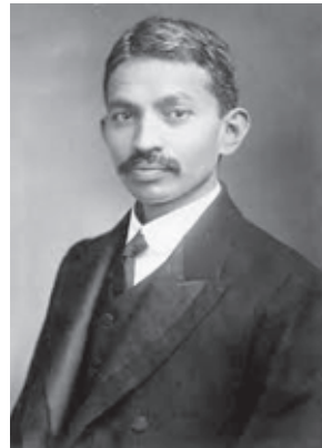
चित्र 8.3 मोहनदास करमचन्द गाँधी

मोहनदास करमचन्द गाँधी एक ब्रिटेन से प्रशिक्षित वकील थे। वे 1893 में दक्षिण अफ्रीका गए और वहाँ इक्कीस वर्षों तक रहे। अंग्रेजों द्वारा दक्षिण अफ्रीका में भारतीयों के साथ दुर्व्यवहार ने उनकी अंतरात्मा को झकझोड़ दिया। उसने दक्षिण अफ्रीकी सरकार के जातीय विभेद के खिलाफ लड़ने का निर्णय किया। सरकार से संघर्ष करने के दौरान उसने सत्याग्रह (सत्य और न्याय के लिए अहिंसक विरोध) की तकनीक विकसित की। गाँधीजी दक्षिण अफ्रीका में इस संघर्ष में सफल रहे। वे 1915 में भारत लौटे। 1916 में उन्होंने सत्य के विचार एवं अहिंसा पर अभ्यास के लिए अहमदाबाद में साबरमती आश्रम की स्थापना की। गोपाल कृष्ण गोखले ने उन्हें देश भ्रमण मुख्यतः गावों में लोगों और उनकी समस्याओं को समझने की सलाह दी। सत्याग्रह में उनका प्रथम प्रयोग बिहार के चम्पारण में 1917 में प्रारंभ हुआ यहाँ वे किसानों की समस्याओं को सुनने के लिए आमंत्रित किए गए थे। इस समझ के आधार पर उसने चम्पारण, खेड़ा और अहमदाबाद के स्थानीय हलचल का सफलतापूर्वक नेतृत्व किया।