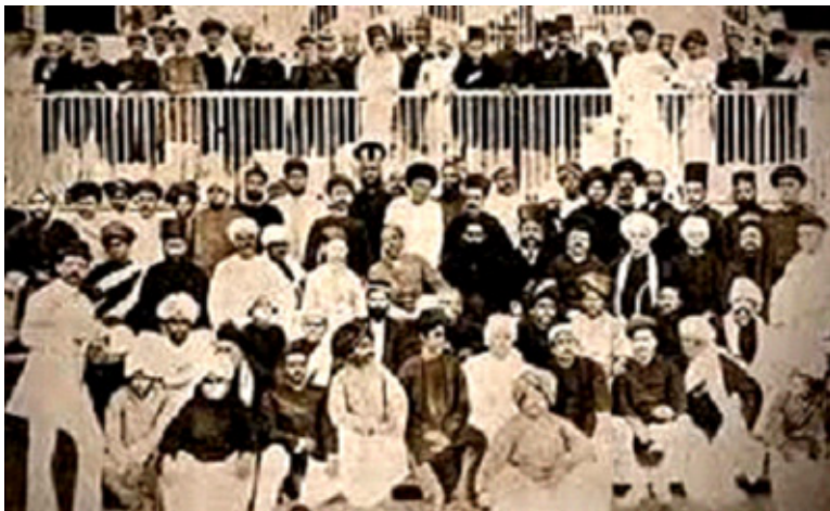
चित्र 8.1 भारतीय राष्ट्रीय कांग्रेस अधिवेशन 1885

भारतीय राष्ट्रीय कांग्रेस की स्थापना 1885 में एलेन ऑक्टावियन ह्यूम द्वारा की गई। ह्यूम एक सेवानिवृत्त सिविल सेवा अधिकारी थे। उसने भारतीयों में राजनीतिक सजगता को बढ़ते देखा और वे इसे एक सुरक्षित संवैधानिक स्वरूप देना चाहते थे ताकि उनका असंतोष भारत में अंग्रेजी शासन के विरुद्ध सार्वजनिक क्रोध के रूप में विकसित न हो सके। इस योजना में उन्हें वायसराय लॉर्ड डफरिन एवं प्रसिद्ध भारतीयों के एक समूह की मदद मिली। कलकत्ता (कोलकाता) के वोमेश चन्द्र बनर्जी इसके पहले अध्यक्ष के रूप में चुने गए। भारतीय राष्ट्रीय कांग्रेस राजनैतिक रूप से सजग भारतीयों का उनकी बेहतरी के लिए काम करने के लिए राष्ट्रीय संगठन स्थापित करने के लिए काम करने के हेतु विचार रखते थे। इनके नेताओं का ब्रिटिश सरकार और इसके न्याय में पूरा विश्वास था। वे मानते थे कि यदि वे सरकार के सामने तर्क पूर्ण ढंग से शिकायत रखेंगे तो अंग्रेज निश्चित रूप से उनमें सुधार करेंगे। इन उदार नेताओं में सबसे प्रसिद्ध फिरोजशाह मेहता, गोपाल कृष्ण गोखले, दादा भाई नौरोजी, रास बिहारी बोस, बदरुद्दीन तयैबजी इत्यादि थे। 1885 से 1905 तक भारतीय राष्ट्रीय कांग्रेस का बहुत संकीर्ण सामाजिक आधार था।