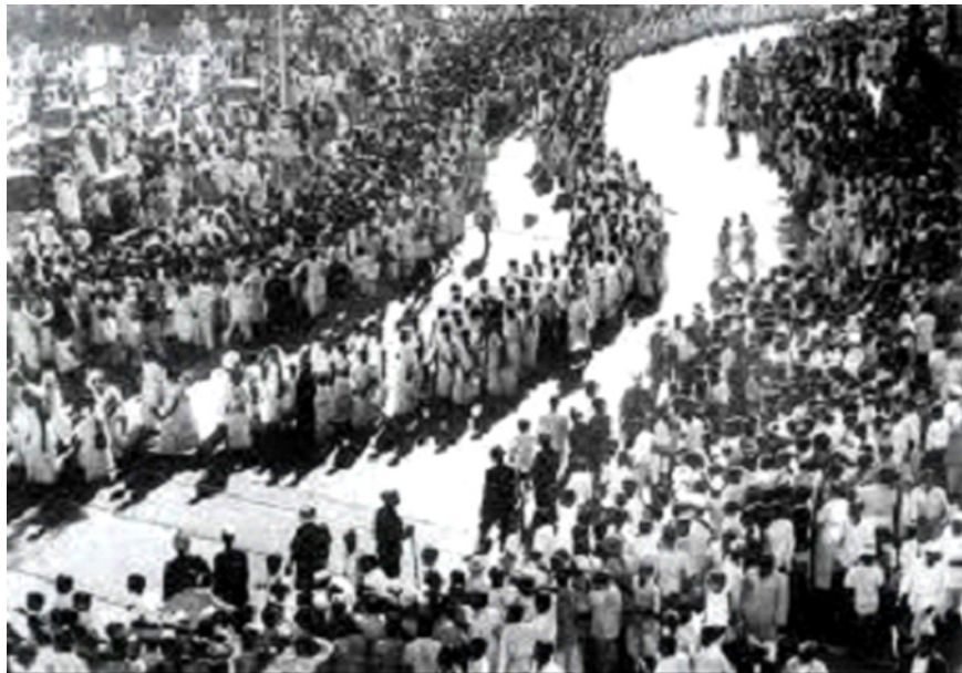
चित्र 8.8: भारत छोड़ो आंदोलन (अगस्त 1942)

जनप्रिय नेताओं की गिरफ्तारी की खबर ने राष्ट्र को सदमे में डाल दिया। उनका क्रोध और असंतोष असंख्य विरोधों, हड़तालों, जुलूसों और विरोध प्रदर्शनों द्वारा देश के सभी भागों में व्यक्त हुआ। अधिकांश नेताओं के जेलों में होने से आन्दोलन ने विभिन्न जगहों पर विभिन्न रूप ले लिया। लोगों ने सरकारी भवन, पुलिस स्टेशन, पोस्ट ऑफिस और अन्य कोई भी चीज जो अंग्रेजों के अधिकार में आता था, को जलाकर अपने क्रोध को खुलकर व्यक्त किया। रेल और टेलिग्राफ की लाइनें तोड़ दी गईं। कुछ स्थानों पर जैसे उत्तर प्रदेश के बलिया जिला में, पश्चिम बंगाल