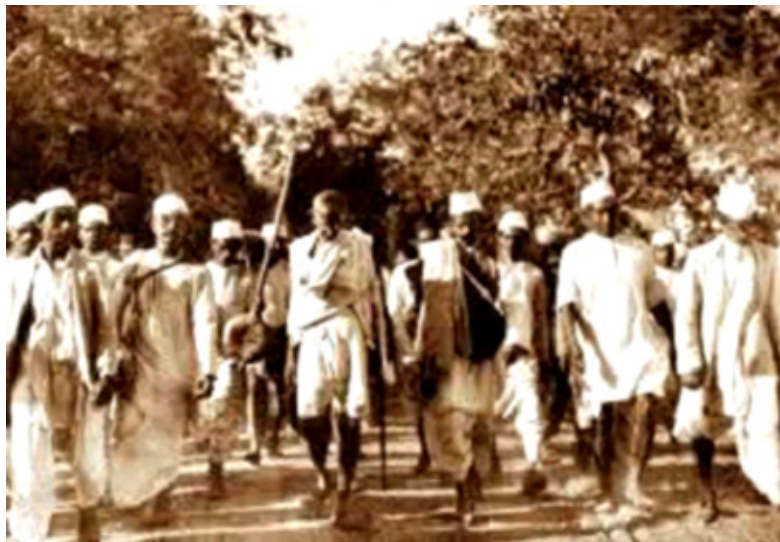
चित्र 8.5: दांडी मार्च के दौरान गांधी

उसी समय सरकार ने एक नया कानून बनाया। उन्होंने नमक के उपयोग पर टैक्स लगा दिया जिसका लोगों ने विरोध किया क्योंकि नमक लोगों की मूलभूत आवश्यकता थी। लेकिन लोगों की माँग पर कोई ध्यान नहीं दिया गया। मार्च-अप्रैल 1930 के समय गाँधी जी ने अपने साबरमती आश्रम से गुजरात के तट दांडी तक सरकार के नमक कानून को तोड़ने के उद्देश्य से यात्रा की। यह एक शांतिपूर्ण यात्रा थी। गाँधीजी ने 06 अप्रैल 1930 को नमक कानून को कुशलतापूर्वक तोड़ने के लिए मन बना लिया था। 06 अप्रैल 1930 को उन्होंने बिखड़े पड़े समुद्री नमक को उठाकर इस कानून को तोड़ा। इस आंदोलन में किसान व्यापारी तथा औरतों ने भी बड़ी संख्या में हिस्सा लिया। सरकार ने उन्हें मई 1930 में गिरफ्तार कर लिया तथा पूना के यरवदा जेल में रख दिया। इस यात्रा का पूरी बदलती दुनिया पर और अंग्रेजों की भारतीय प्रवृत्ति पर बहुत महत्वपूर्ण असर हुआ। 1931 का गाँधी-इरविन समझौता उसी का एक उदाहरण था। गाँधीजी 1931 में कांग्रेस के एकमात्र प्रतिनिधि बनकर गोलमेज सम्मेलन में भाग लेने इंग्लैंड भी गए।