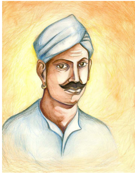
चित्र 7.8 मंगल पाण्डे

मंगल पाण्डे पहला ऐसा सैनिक था जिसने खुले रूप में आदेशों का उल्लंघन किया। कलकत्ता के पास बैरकपुर में 29 मार्च 1857 को उसने दो अंग्रेज अफसरों की हत्या कर दी। उसे गिरफ्तार करके उस पर मुकदमा चलाया गया और फांसी दे दी गई। बैरकपुर की रेजीमेंट को तोड़ दिया गया। मंगल पाण्डे का समाचार बहुत जल्दी देश के दूसरे भागों तक पहुंच गया और परिणामस्वरूप खुले विद्रोह भड़क उठे। सबसे निर्णायक विद्रोह मेरठ में हुआ जहाँ पर घुड़सवार (कैवेलरी) रेजीमेंट के 85 सैनिकों को चर्बी वाले कारतूसों का प्रयोग करने से इंकार करने पर 2-10 वर्षों के कारावास की सजा दे दी गई। इसके अगले ही दिन अर्थात् 10 मई 1857 को तीन रेजीमेंटों ने खुली बगावत कर दी। उन्होंने अंग्रेज अफसरों की हत्या कर दी और अपने साथी सैनिकों को छुड़ाने के लिए जेलों को तोड़ दिया। उन्होंने दिल्ली की ओर कूच (मार्च) शुरू कर दिया, जहाँ उनके साथ स्थानीय पैदल सेना और सामान्य लोग भी मिल गए। बागियों ने दिल्ली पर कब्जा कर लिया और अनेक अंग्रेज अफसरों की हत्या कर दी। उन्होंने मुगल बादशाह बहादुरशाह को भारत का सम्राट घोषित कर दिया।