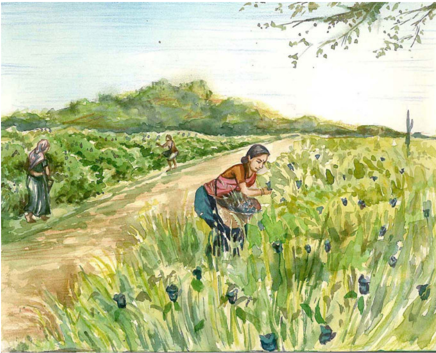
चित्र 7.3 : बंगाल में नील की कृषि

तो बहुत सस्ते दामों पर बेचने के लिए निर्भर होना पड़ता था। उन्होंने ज़मींदारों को अपना वर्चस्व बनाये रखने और उनके द्वारा शासित क्षेत्रों में उनकी समस्याओं के समाधान करने के लिए समर्थन दिया। किसानों ने बंगाल में नील की खेती न किए जाने के लिए एक अभियान चलाया। हिन्दु और मुसलमान किसानों ने मिलकर हड़तालें की और सबने मिलकर मालिकों पर कानूनी केस दर्ज करा दिए। प्रैस और मिशनरियों ने इनका समर्थन किया। नवम्बर 1860 में सरकार ने आदेश जारी किया, जिसमें अधिसूचित किया गया कि रैय्यतों को नील की खेती करने के लिए बाध्य करना गैर-कानूनी है। विद्रोहियों के लिए इसे बड़ी जीत माना गया।