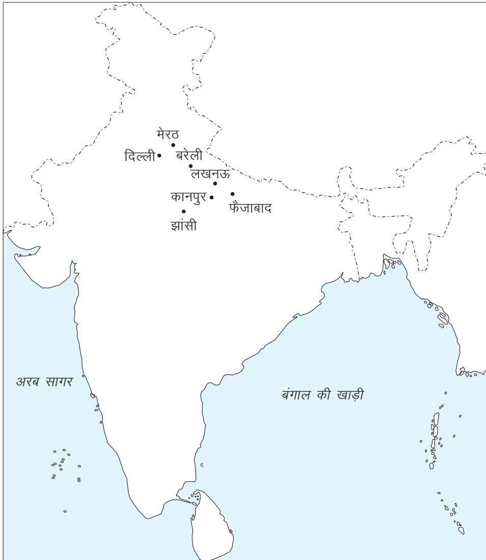
चित्र 7.7 1857 के विद्रोह के प्रमुख केन्द्र

(क) राजनीतिक कारण: राज्यों को अपने राज्य में मिलाने की नीति (कब्जे) के द्वारा औपनिवेशीय विस्तार की प्रकृति, भारतीय शासकों में असंतोष का प्रमुख कारण बना। अंग्रेज जमीन