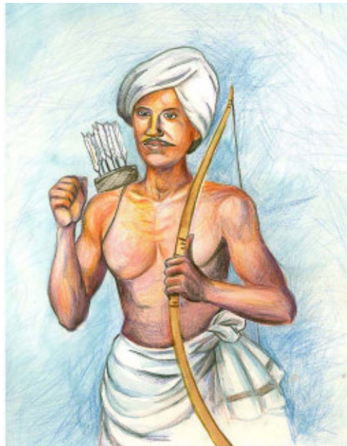
चित्र 7.5 बिरसा मुंडा

1908 के छोटानागपुर काश्तकारी अधिनियम (टीनेंस एक्ट) के अधीन लोगों को भूमि पर कुछ स्वामित्व अधिकार प्रदान किए गए और जनजातियों की बंधुआ मजूदरी पर भी रोक लगा दी गई। बिरसा मुंडा, मुंडा विद्रोह के निर्माता और एक ऐसे व्यक्ति बन गए जिन्हें आज भी याद किया जाता है।