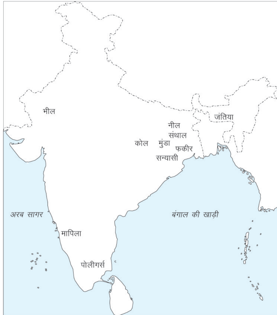
चित्र 7.1 भारत का मानचित्र: 19वीं शताब्दी में किसानों और जनजातियों के विद्रोह से संबंध विविध स्थल

आपको यह जानकर आश्चर्य होगा कि 1760 की कालावधि से शुरू करें तो सन्यासी विद्रोह और बंगाल और बिहार में मछुआरों के विद्रोह तक शायद ही कोई वर्ष होगा जिसमें कोई सैनिक विद्रोह नहीं हुआ। 1763 से 1856 तक छोटे-छोटे विद्रोहों को छोड़कर 40 मुख्य विद्रोह हुए। तथापि, यह सभी विद्रोह विशिष्टताओं और प्रभाव की दृष्टि से स्थानीय ही थे। वे सभी परस्पर भिन्न प्रकृति के थे क्योंकि प्रत्येक विद्रोह का भिन्न लक्ष्य था। इस पाठ के अगले खंड में हम इन आंदोलनों के संबंध में अधिक विस्तार से पढ़ेंगे।