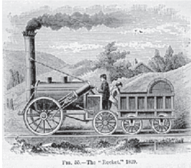
चित्र 4.2 : जार्ज स्टीफेंसन का स्टीम इंजन

मध्य 19वीं शताब्दी के दौरान लकड़ी चालित जहाज की जगह भाप चालित ने जहाज ले लिया। इसके तुरंत बाद लोहा जहाज समुद्र के पार यात्रा के लिए इस्तेमाल किया गया था। यद्यपि औद्योगिक क्रांति के पहले चरण में भाप पर निर्भर करता है, तो दूसरे चरण में बिजली पर निर्भर था। क्या आप जानते हैं माइकल फैराडे ने पहली इलेक्ट्रिक मोटर की खोज करने का गौरव प्राप्त था? बिजली अब व्यावसायिक रूप से उपलब्ध हो गयी और कारखानों को चलाने के लिए इस्तेमाल किया जाने लगा था। परिवहन, व्यापारिक लेनदेन और संचार के तेजी से मतलब है, सैनिक इकाइयों, कालोनियों, देशों, और यहां तक कि आम लोगों के बीच तेजी संपर्क बढ़ना। टेलीग्राफ और टेलीफोन के आविष्कार ने दुनिया में कहीं भी तुरंत संवाद संभव बनाया है।