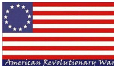
चित्र 3.5 अमेरिकी स्वतंत्रता संग्राम का ध्वज