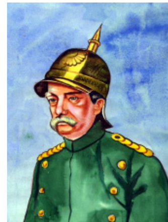
चित्र 3.6 : ओटो वोन बिस्मार्क

1815 में नेपोलियन की हार के बाद, कई जर्मन एक स्वतंत्र जर्मनी चाहते थे। जर्मनी 39 छोटे राज्यों का संघ था और ऑस्ट्रिया और प्रशिया के नेतृत्व में था। ये राज्य हमेशा एक दूसरे के साथ युद्ध की स्थिति में थे, प्रशिया को राजा, कैसर विलियम प्रथम प्रधानमंत्री विस्मार्क को प्रशिया के शासन के अधीन जर्मनी को एकजुट, करना चाहता था और ऑस्ट्रिया और फ्रांस को पूरी तरह से बाहर रखना चाहता था बिस्मार्क निडर था और उसे जर्मनी के एकीकरण की तत्काल आवश्यकता में विश्वास था यह उसने सेना के आधुनिकीकरण के साथ शुरू किया, उसने खून और आयरन की नीति के लिए जाना जाने लगा और उसने लौह चासंलर की उपनाम अर्जित किया।