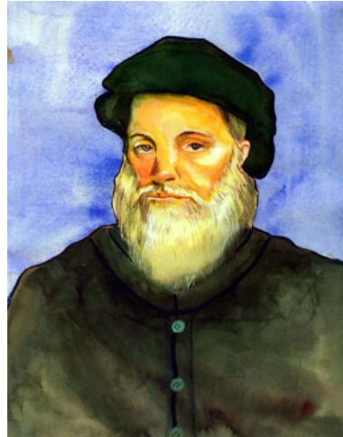
चित्र 3.3 : वास्को दा गामा

तुम्हें क्यों लगता है कि महान रोमांची यात्रा राजा और अमीर लोगों द्वारा प्रायोजित की गई थी? व्यापार और औपनिवेशीकरण में जबरदस्त वृद्धि से यूरोपीय धन वृद्धि पर एक महान प्रभाव पड़ा। एक सबसे प्रसिद्ध राजा जो यात्रा को प्रायोजित करता था पुर्तगाली था। वह था राजा हेनरी जो हेनरी नेविगटर के रूप में भी जाना जाता है। इन खोजों के लिए तकनीकी आधार कम्पास, वेधयंत्रकी, खगोलीय सारणी और नक्शे बनाने के कला के आविष्कार से हुआ। इन यात्राओं से विश्व के विभिन्न भागों में जैसे- अफ्रीका, अमेरिका और एशिया में व्यापारिक चौकी बनाने और औपनिवेशिक साम्राज्य की स्थापना के लिए मार्ग प्रशस्त हुआ। अब वाणिज्यिक रुचि अटलांटिक महासागर से भूमध्य सागर से स्थानांतरित हो गई। कई नई वस्तुएं जैसे तम्बाकू, गुड़, शतुरमुर्ग पंख, आलू, आदि व्यापार में शामिल की गई। इसने अमानवीय दास व्यापार की शुरुआत की। गुलाम अफ्रीका से पकड़ कर अटलांटिक महासागर के पार और उत्तरी अमेरिका में वृक्षारोपण में काम करने के लिए बेचे जाते थे। इन व्यापार पद्धतियों और नई समुद्री मार्गों