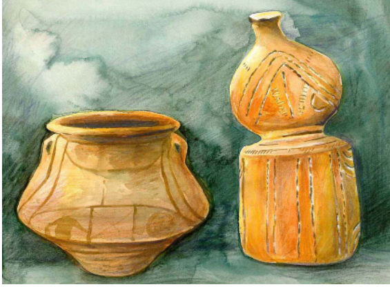
चित्र 0.3 : नवपाषाण युगीन बर्तन

बड़ा इस्तेमाल गाड़ी के काम आता था जो कि सामान को एक जगह से दूसरी जगह ले जाया करता था। आज भी यह पहिये कई जरूरी काम में सहायक होते हैं।