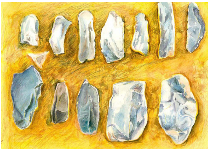
चित्र 0.2 : पाषाणयुगीन औजार

आग की ही तरह औजारों का प्रयोग भी एक जरूरी खोज थी। यह औजार जो उस समय के थे उनको 'साईको लिथसा कहते हैं। यह तेज थे और बहुत काम के भी थे। इनके लिये जानवरों की हड्डीयों का प्रयोग किया गया था। इनसे औजार तथा हथियार जैसे कि छेद करने के लिये। उठाने के लिये, तीर, काँटे, तीर के नुकीले कोण तथा हथोड़ी तथा काटने वाले तथा कुल्हाड़ी जिससे की छोटे पेड कट सकें। इससे वह जानवरों का शिकार खाने के लिये तथा अपने रहने के लिये छोटी छोटी झुगीयाँ बनाने के काम में लाये। छोटे पत्थरों को तराशों के साथ ही उन्होने इन पत्थरों को चाकू की तेज धार वाला बना लिया। इन पत्थरों को, अपने तीर और भाले में जोड़कर ज्यादा फायदेमंद बना लिया। अब वह एक सुरक्षित दूरी से भी जानवरों का शिकार कर सकते थे। ऐसे ही कुछ पत्थर और हथियार हमें पंजाब कश्मीर की घाटियों, हिमालयों के निचले हिस्सों में तथा नर्मदा घाटी में मिले हैं। अगर आप पुस्तकालय में जाकर या इंटरनेट पर इन चीजों के बारे में जानकारी प्राप्त करेंगे तो ऐसी कई जगहों की विवरण आपको मिल जायेंगे।