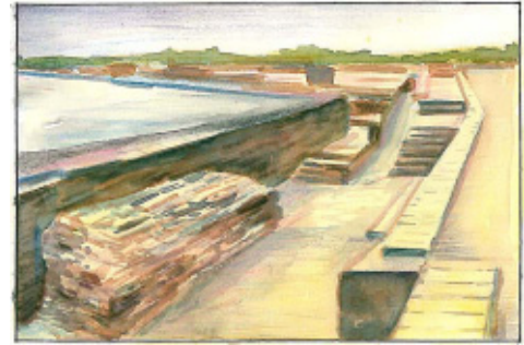
चित्र 0.6 : सिंधुघाटी सभ्यता का पतन लोथल (गुजरात)

जिन्दगी कुछ लोगों के लिये तो काफी आरामदायक हो गयी थी। शीघ्र ही शहरों ने भी अपनी अपनी पहचान बना ली इनमें से कुछ राजधानी शहरों में तबदील हो गये। ऐसे शहरों में हमे ऊँची-ऊँची मीनारें व भवन, जरूरी दफतर, बड़े व्यापारिक भवन तथा कारखानों की भरमार है। जीवन कुछ लोगों के लिये काफी सरल व अच्छी हो गयी है। हम लोगों ने इस समय बहुत सी खोजें, नई वस्तुओं का बनाना आदि साफ पानी पीने के लिये भी उपलब्ध नहीं है। इस की बजह से कई समस्यायें खड़ी हो गयी है जिसका समाधान हम लोगों को दूढना पड़ेगा। इन सब चीजों के बारे में हम इस पाठ में पढ़ेंगे।