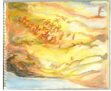
चित्र 0.1 : भीमबेटका गुफा में चित्रकारी