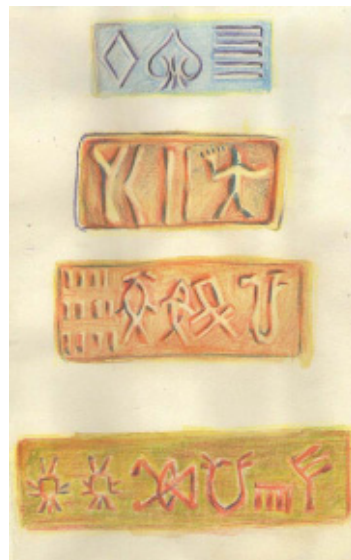
चित्र 0.5 : हडप्पा अभिलेख