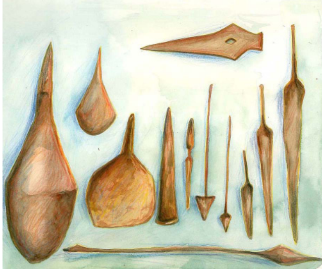
चित्र 0.4 : कांस्य युगीन औजार

इस युग में मनुष्य ने ताँबे से सामान बनाना शुरू कर दिया। क्या आप यह पढ़ चुके होंगे कि मिट्टी के वर्तन बनाने के लिये आग का इस्तेमाल होता था। यह अब भी भट्टी के रूप में काम आता है। ताँबा वो पहला धातू था जो कि पिघला कर दूसरी चीजों को बनाने में काम आया।