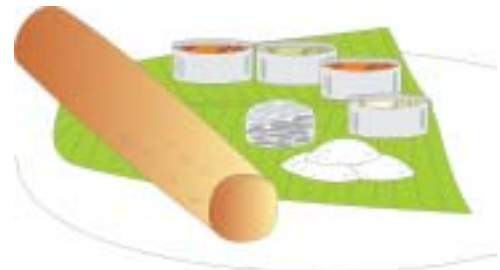
दक्षिण भारतीय थाली