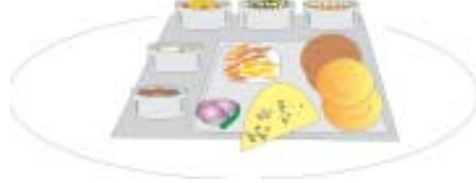
उत्तर भारतीय थाली

भोजन पिरामिड का प्रयोग करते हुए अपने परिवार के आहार का आकलन कीजिए और पता कीजिए कि क्या आप संतुलित आहार ले रहे हैं या नहीं? क्या अब आप महसूस करते हैं कि आपके माता-पिता परिवार को संतुलित आहार उपलब्ध कराने के लिए कितना प्रयास करते हैं? वे सभी भोजन समूहों को आपके आहार में शामिल करने के लिए योजना बनाते हैं, उन्हें खरीदते हैं, तैयार करते हैं और पकाते हैं।