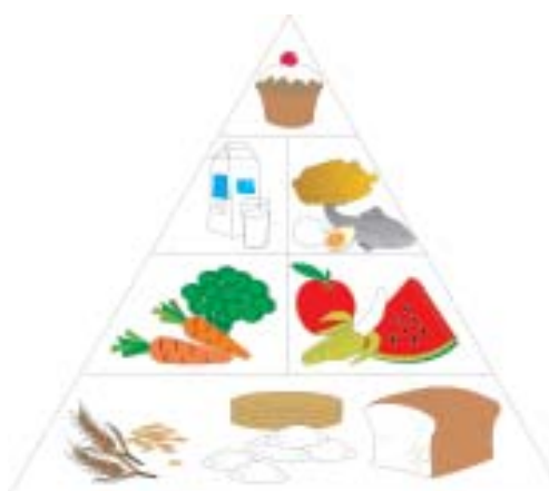
चित्र.3.5 भोजन पिरामिड

भोजन समूह का पिरामिड स्पष्ट रूप से दर्शाता है कि हमें अच्छा स्वास्थ्य प्राप्त करने के लिए प्रत्येक पाँच भोजन समूहों में से भोजन का सेवन करना चाहिए। पिरामिड हमें यह भी बताता है कि हमें भोजन पिरामिड के शीर्ष पर दर्शाए गए भोज्य पदार्थों जैसे वसा तथा शर्करा को पिरामिड के निचले भाग में दर्शाए गए अनाज और दालों की तुलना में कम खाना चाहिए। भोजन पिरामिड का प्रयोग न केवल अच्छे स्वास्थ्य को सुनिश्चित करता है बल्कि संतुलित आहार के नियोजन तथा वैकल्पिक भोजन के चयन में भी सहायक होता है।