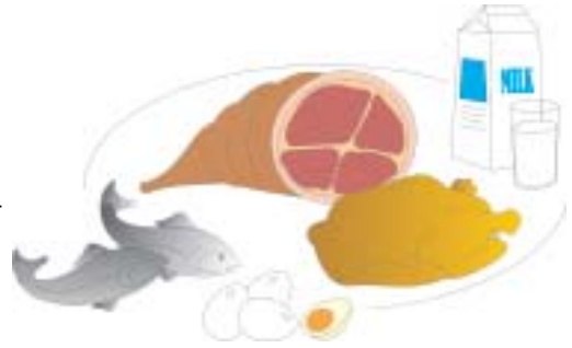
चित्र. 3.3 दूध, अंडा तथा मांस के उत्पाद

आप सभी जानते हैं कि छोटे बच्चों के लिए दूध को सर्वोत्तम तथा सम्पूर्ण आहार माना जाता है। क्या आप जानते हैं कि ऐसा क्यों है? जी हाँ, क्योंकि दूध में प्रोटीन, वसा, विटामिन ए तथा कैल्शियम प्रचुर मात्रा में होता है। दही और पनीर में भी सभी पौष्टिक तत्व होते हैं किन्तु मक्खन रहित दूध (skimmed milk) में वसा की मात्रा बहुत कम होती है।