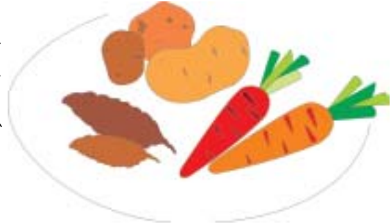
चित्र. 3.4 जड़ सब्जियाँ

अन्य सब्जियाँ: आलू, शकरकंदी, शलगम, गाजर तथा मूली जड़ सब्जियों के कुछ उदाहरण हैं। ये जड़ सब्जियाँ कार्बोहाईड्रेट के अच्छे स्रोत हैं। हम सब जानते हैं कि आलू को सभी सब्जियों का राजा माना जाता है। क्या आप जानते हैं कि आलू में भी विटामिन सी और कार्बोहाईड्रेट होता है?