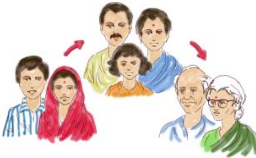
चित्र 19.2 परिवार जीवन चक्र

अपने परिवार के विषय में सोचें। जब आपके माता-पिता का विवाह हुआ था और उन्होंने अपना पारिवारिक जीवन शुरू किया था तब उनका पारिवारिक जीवन चक्र प्रारंभ हुआ। सबसे बड़े बच्चे के जन्म के साथ ही परिवार विस्तार के चरण में प्रवेश करता है। जब आप सब जीवन में व्यवस्थित होकर अपनी गृहस्थी सँभालेंगे तब आपके माता-पिता का परिवार संकुचन की स्थिति में होगा। ये तीनों परिवार के जीवन के तीन विभिन्न पहलू हैं।