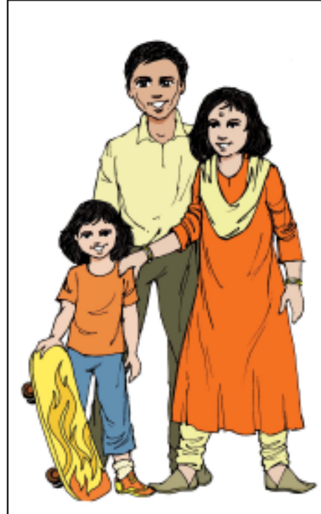
चित्र 19.1 परिवार के प्रकार