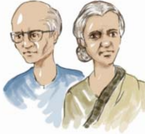
चित्र: 19.5: बुजुर्ग

बहरहाल, कई बार सेवानिवृत्ति कष्टदायक भी हो सकती है यदि व्यक्ति ने अपने भावी जीवन के लिए वित्तीय व्यवस्था नहीं की है तथा अपने अच्छे स्वास्थ्य के लिए प्रावधान नहीं किए हैं। आपको क्या लगता है कि ऐसे व्यक्ति का क्या होगा जिसके पास सेवानिवृत्ति के पश्चात कोई सपोर्ट सिस्टम नहीं है तथा वह वित्तीय रूप से भी सक्षम नहीं है?