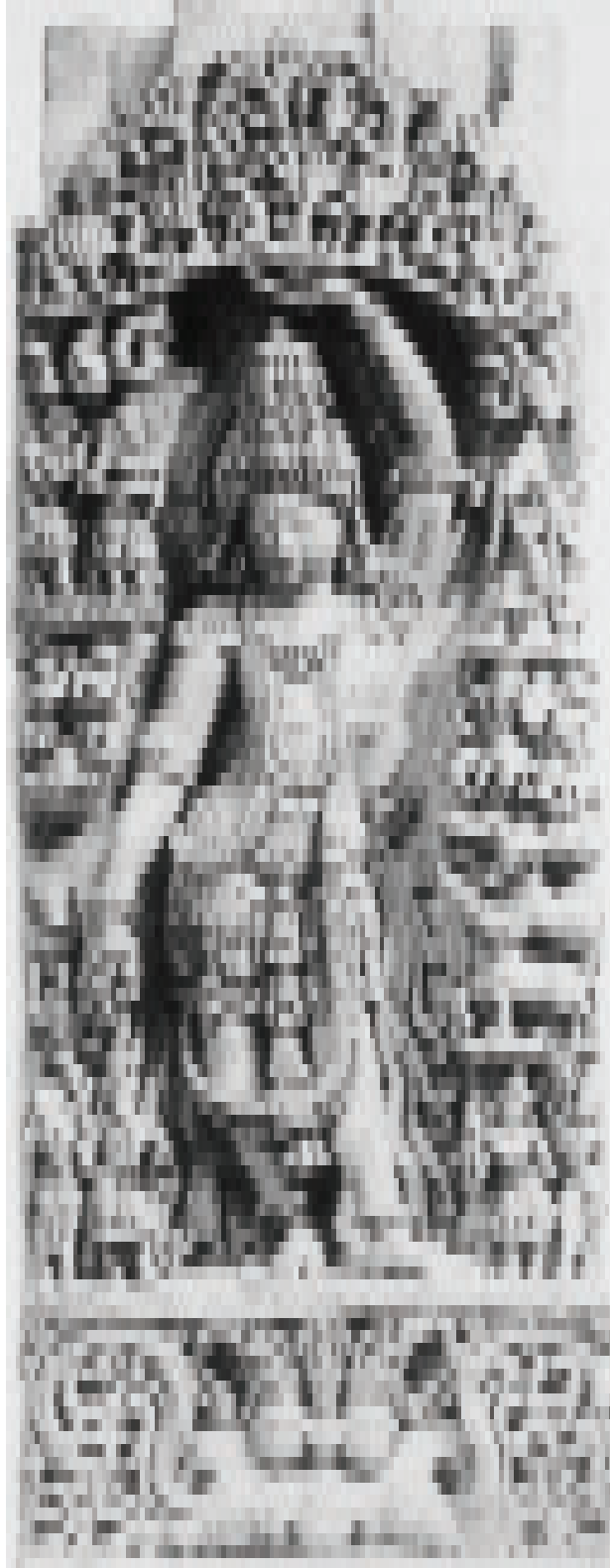
गोवर्धन पर्वत को उठाते हुए कृष्ण

सातवीं से बारहवीं शताब्दी तक कला का इतिहास तथा मूल्यांकन