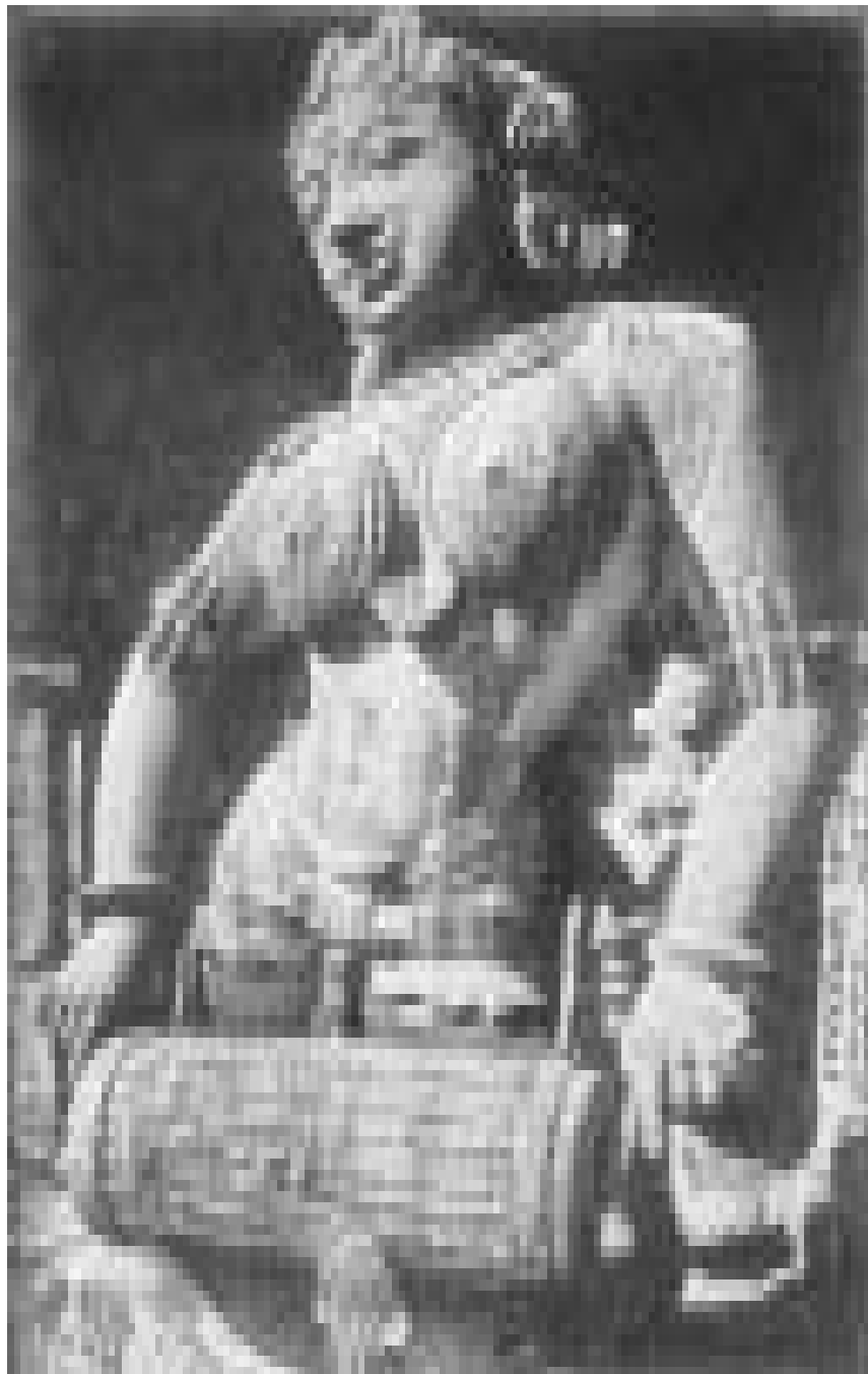
कोणार्क की सुरसुन्दरी