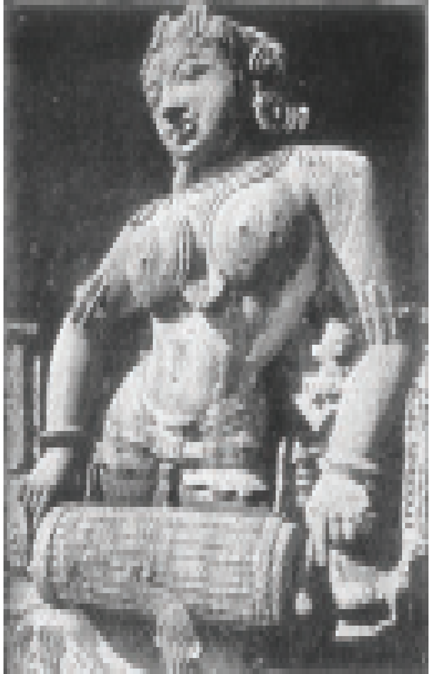
कोणार्क की सुरसुन्दरी

सातवीं से बारहवीं शताब्दी तक कला का इतिहास तथा मूल्यांकन