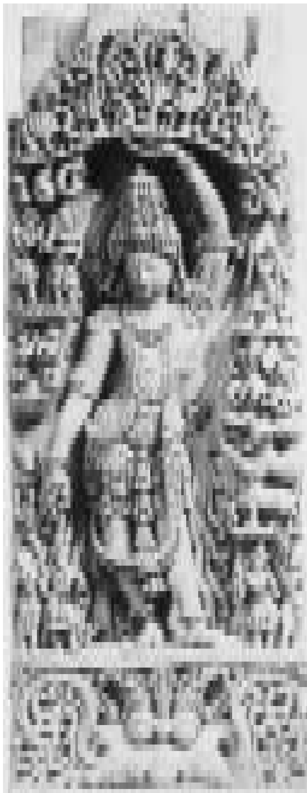
गोवर्धन पर्वत को उठाते हुए कृष्ण