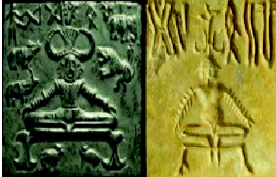
चित्र 1.1 योग से सम्बंधित प्राचीन सील (टप्पा )

योग परंपरा में, शिव को पहले योगी या आदियोगी, और पहले गुरु या आदि गुरु के रूप में देखा जाता है। सिंधु सरस्वती घाटी सभ्यता में खोजी गई सीलों और जीवाश्मों की संख्या योग गतिविधियों और योग प्रदर्शन करने वाले आंकड़े दिखाती है, जो प्राचीन भारत में योग की उपस्थिति का सुझाव देती है।