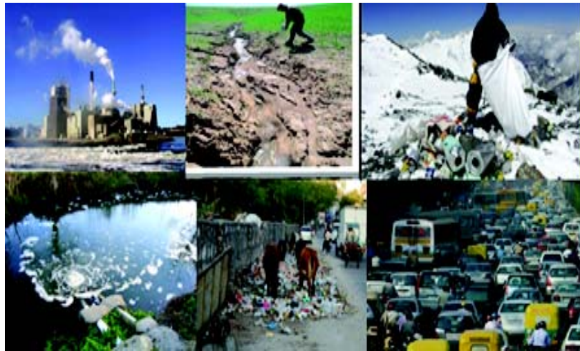
चित्रम् 5.1 प्रदूषणम्

वैदिकवाङ्मये अपि कृत्रिमोपकरणैः तथा विषयुक्तरसायनैः पर्यावरण प्रदूषणस्योल्लेखो मिलति, यस्मिन् वायुः, जलम्, तथा मृदाप्रदूषणं सम्मिलितम् अस्ति । मानवजीवने विभिन्नैः दैनिकक्रियाः सम्मिलिताः सन्ति । फेनिलेन वस्त्रप्रक्षालेन कानिचन रसायनिक तत्वानि जले मिलन्ति तथा तस्य गुणवत्तां परिवर्तयति । काष्ठेन भोजनपचनेनापि धूम्रः वायौ प्रसारितो भवति । आधुनिके विश्वे कृषिकार्यैः कीटनाशकाः पर्यावरणे मिलितुं शक्यन्ते ।