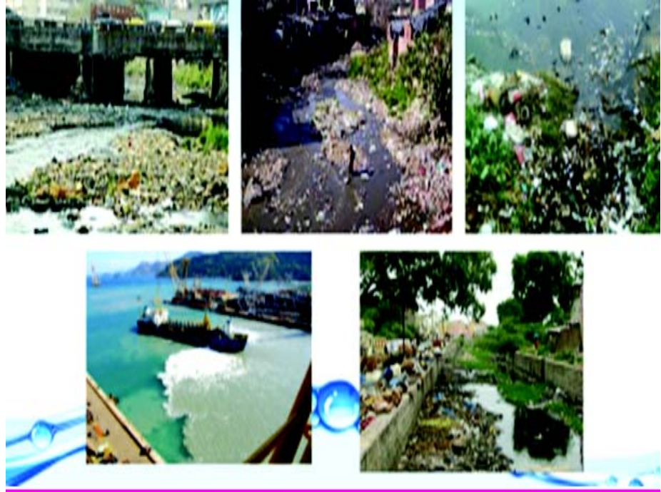
चित्रम् 5.3 जल-प्रदूषणम्

सरोवरे नद्यां भूमगतजले समुद्रे इत्यादिषु प्रदूषणं जलप्रदूषणं कथ्यते । जलस्रोतेषु शुद्धिकरणेन विना प्रदूषितं जलं निक्षेपेण एतत् उत्पन्नं भवति । एतत् केवलं तत्स्थानं प्रदूषितं करोति यत्र जले मिलति तथा तज्जलं प्रवहितो भूत्वा अन्यस्थानं प्रदूषितं करोति ।