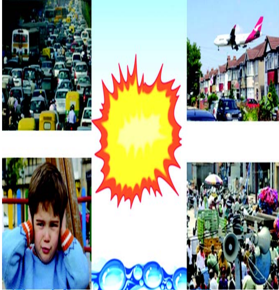
चित्रम् 5.5 ध्वनि-प्रदूषण (क)

ध्वनिः प्रदूषणं सरलशब्देषु अवाञ्छितध्वनिः कथ्यते । एतत् ग्रामीणक्षेत्राणामपेक्षा नगरक्षेत्रेषु तथा औद्योगिकक्षेत्रेषु अधिकं भवति । भारयुक्तयन्त्राणां प्रयोगकर्तारः कर्मचारिणः अधिकसमयपर्यन्तं तीव्रध्वनेः संपर्के निवसन्ति । ध्वनेः तीव्रतां (कठ) रूपे माप्यते । मनुष्येण सर्वाधिकन्यूनतमा श्रूयमाणा ध्वनिः 10 कठ वर्तते ।