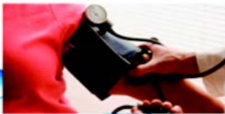
चित्रम् 5.6 ध्वनि प्रदूषण के परिणाम