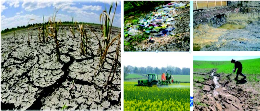
चित्रम् 5.4 मृदा-प्रदूषणम्

मृदायाः प्राकृतिकपर्यावरणे रसायानानि तथा अवांछनीयतत्वानां सम्मिश्रेण मृदाप्रदूषणं भवति । अस्मिन् चित्रे भवन्तः द्रष्टं शक्यन्ते यत् मृदाप्रदूषणेन भूम्याः अपक्षयं भवति यतोहि मृदाप्रदूषणस्य वृद्धौ वयमेव उत्तरदातास्मः ।