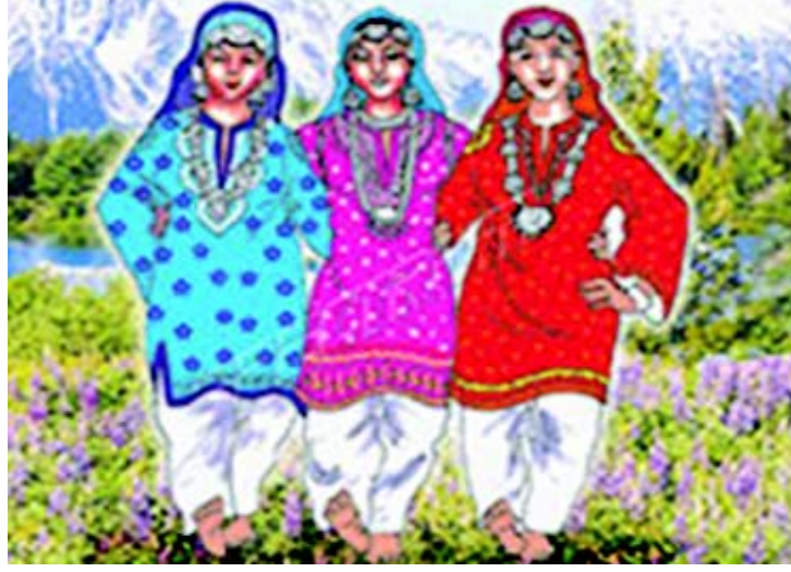
चित्रम् 3.6 जम्मूकश्मीर-प्रदेशस्य नृत्यम्