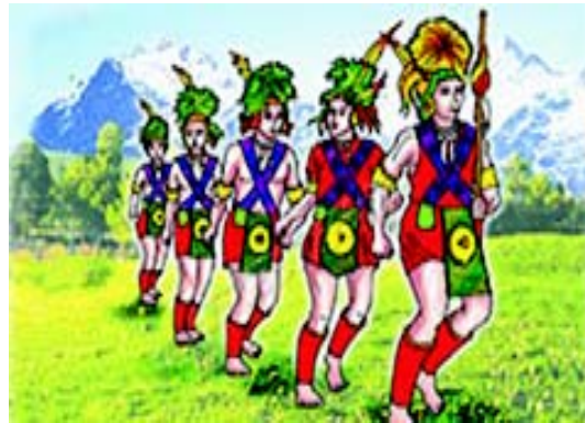
चित्रम् 3.12 नागालैंड-प्रदेशस्य नृत्यम्