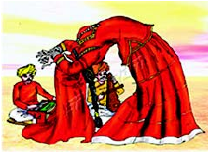
चित्रम् 3.14 राजस्थान-प्रदेशस्य नृत्यम्