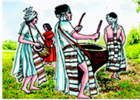
चित्रम् 3.1 मेघालय-प्रदेशस्य नृत्यम्