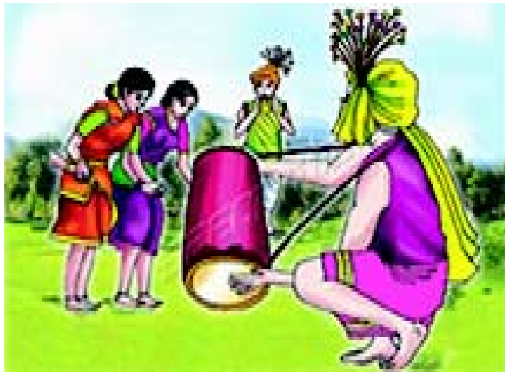
चित्रम् 2.9 मध्य-प्रदेशस्य नृत्यम्