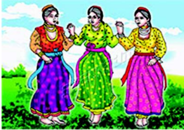
चित्रम् 3.5 हिमाचल-प्रदेशस्य नृत्यम्