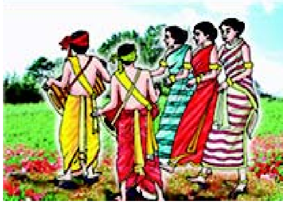
चित्रम् 3.2 बिहार-प्रदेशस्य नृत्यम्

रखाल, लीला, तबल, चोंगली, कैनो, नोगक्रेम, अंकियानट, किर्तनिया नाटकः, तथा ओजापली नृत्यानि सन्ति ।'