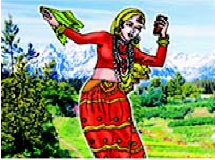
चित्रम् 3.17 उत्तराखण्ड-प्रदेशस्य नृत्यम्