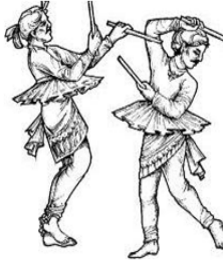
चित्रम् 3.3 गुजरात-प्रदेशस्य नृत्यम्