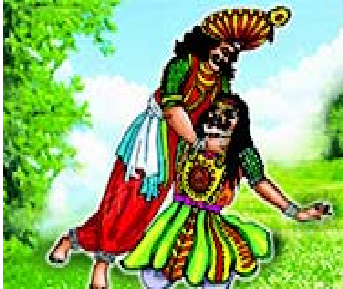
चित्रम् 3.7 कर्णाटक-प्रदेशस्य नृत्यम्