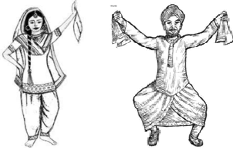
चित्रम् 3.13 पंजाब-प्रदेशस्य नृत्यम्