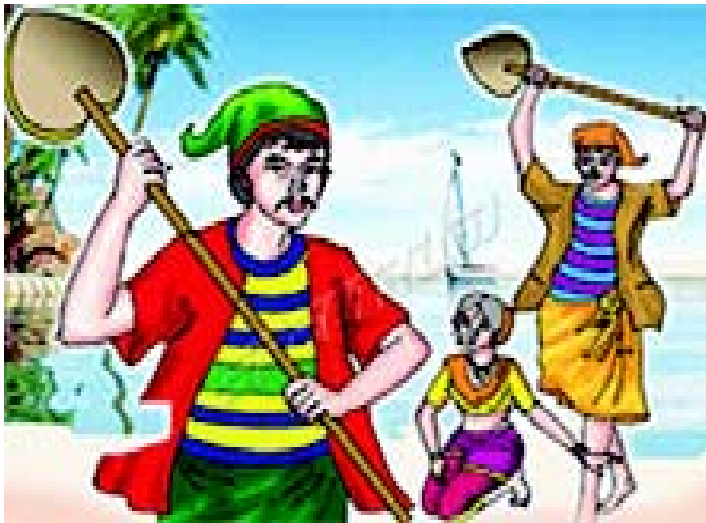
चित्रम् 3.18 गोवा-प्रदेशस्य नृत्यम्