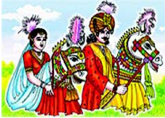
चित्रम् 3.15 तमिलनाड-प्रदेशस्य नृत्यम्