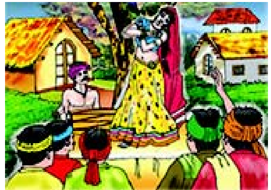
चित्रम् 3.16 उत्तर-प्रदेशस्य नृत्यम्