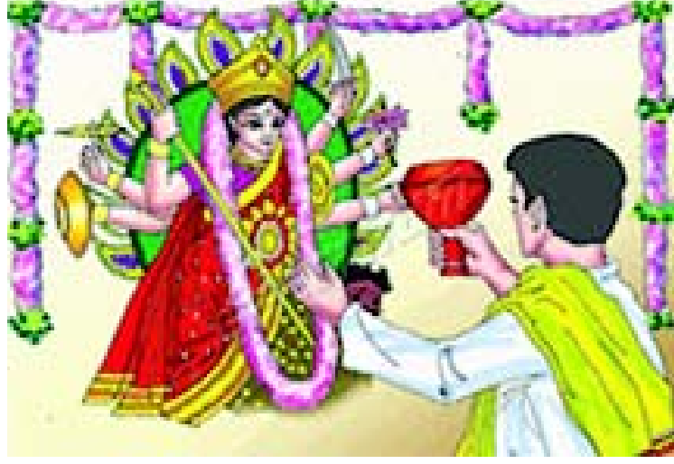
चित्रम् 3.19 बंगप्रदेशस्य नृत्यम्