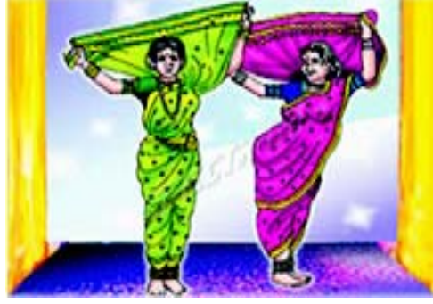
चित्रम् 3.10 महाराष्ट-प्रदेशस्य नृत्यम्