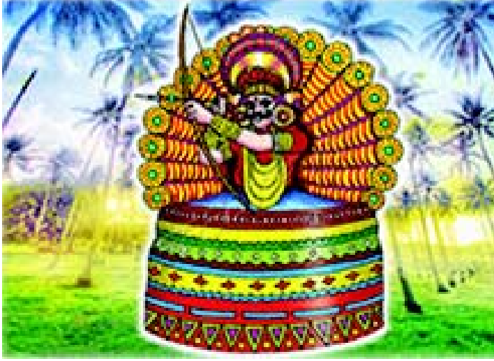
चित्रम् 3.8 केरल-प्रदेशस्य नृत्यम्