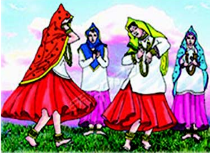
चित्रम् 3.4 हरियाणा-प्रदेशस्य नृत्यम्