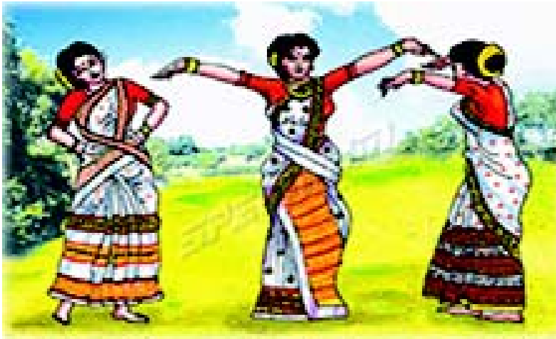
चित्रम् 3.1 असम-प्रदेशस्य नृत्यम्