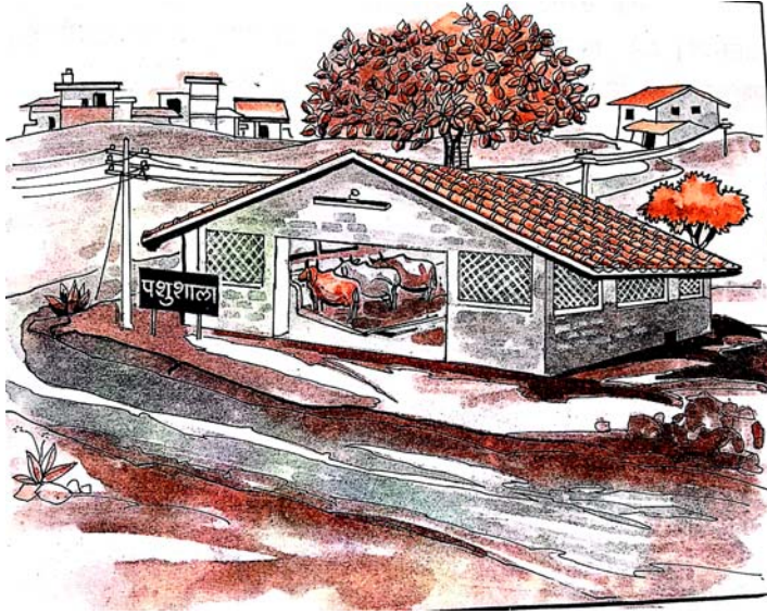
चित्र 8.1 गौशाला

वयं स्वगृहस्य निकटे इतस्ततः प्रायः अनेकाः पश्वाः पश्यामः । तं पालतूपश्वाः भवन्ति । तेषां गौधेनवः अपि भवति । अधुना कथासहायताया वयं गौ-पालनविषये जानीमः । 'प्रीतमः एकः प्रतिभावान-बालकः अस्ति । सरू नगरे वसति । सः स्व-पितरा सह आपणे गच्छति । ततः सः शाकम् क्रीणाति । शाकम् क्रीणत्वा, तस्मात् सह सः दुग्धविक्रेता-राम' इति निकटे गच्छति । रामू पार्श्वे एकः विशालकायः गौशालाः वर्तन्ते । तत्र संः बहवाः पश्वाः पश्यति, यस्मै प्रीतमः एकः गायम् दृष्ट्वा तस्मै ज्ञानं करोति ।