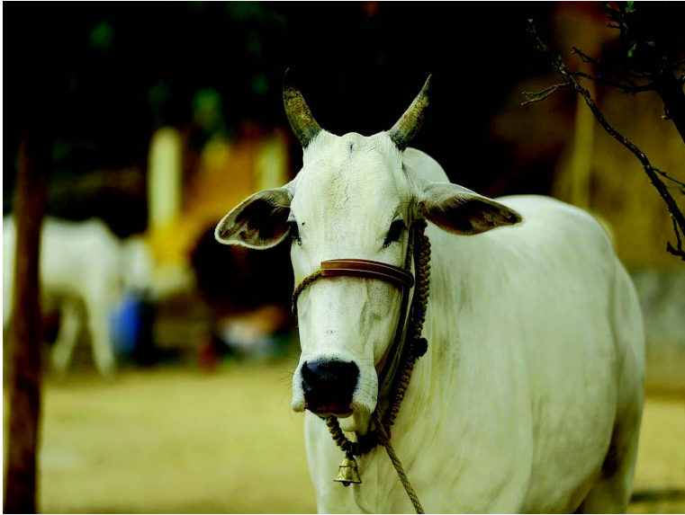
चित्र 8.2 गाय

प्राचीन भारतीयजनाः धेनवं पूज्यन्ते । तस्मात् धेनवस्य वपुः-अंगेन देवताः