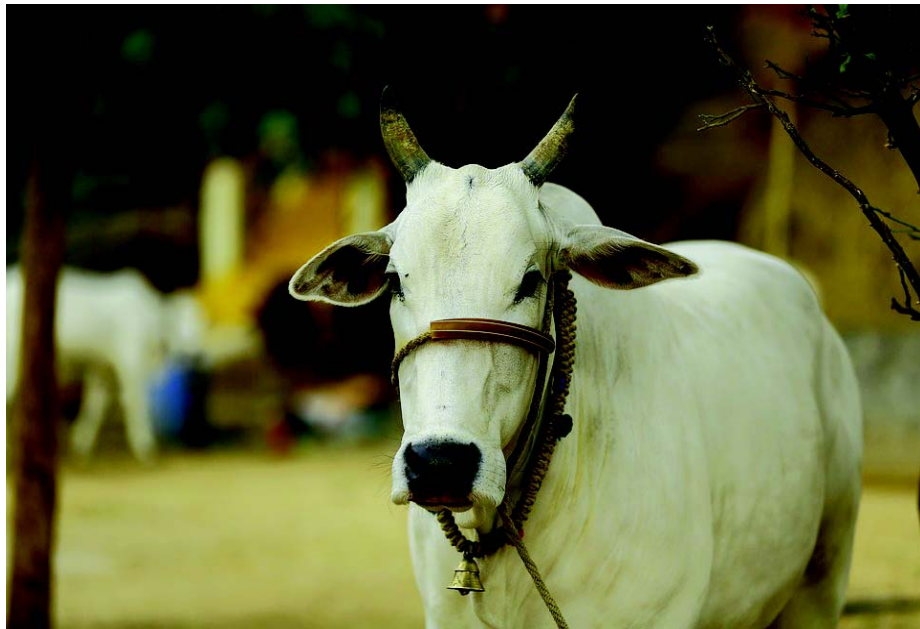
चित्र 1.1 भारतीय गाय

गाय भारतीय कृषि तथा सामाजिक रीति-रिवाजों का एक अभिन्न हिस्सा बन गयी है। वैदिक युग से ही भारत की ग्रामीण अर्थव्यवस्था में उन्होंने एक महत्वपूर्ण भूमिका निभाई है। हम उनका महत्व अपने दैनिक जीवन में देख सकते हैं। वैदिक काल और उसके बाद के कालखंड में भी गायें ग्रामीण अर्थव्यवस्था का केन्द्र बिंदु रही हैं। खेतों की जुताई, बुवाई, गहाई और एक स्थान से दूसरे स्थान तक कृषि उत्पादों के परिवहन में बैलों का प्रयोग होता था। गायों से दूध मिलता था और उससे अन्य उत्पाद बनते थे। गाय से मिलने वाले अन्य उत्पाद, जैसे-गोबर इत्यादि का खाद के रूप में तथा भोजन बनाने के लिए ईंधन के रूप में भी प्रयोग होता था। प्राचीन भारतीय समाज में गाय के महत्व के कारण ही वैदिक ग्रंथों में इसे 'कामधेनु' कहा गया है। कामधेनु अर्थात् सारी इच्छाओं को पूरा करने वाली गाय।