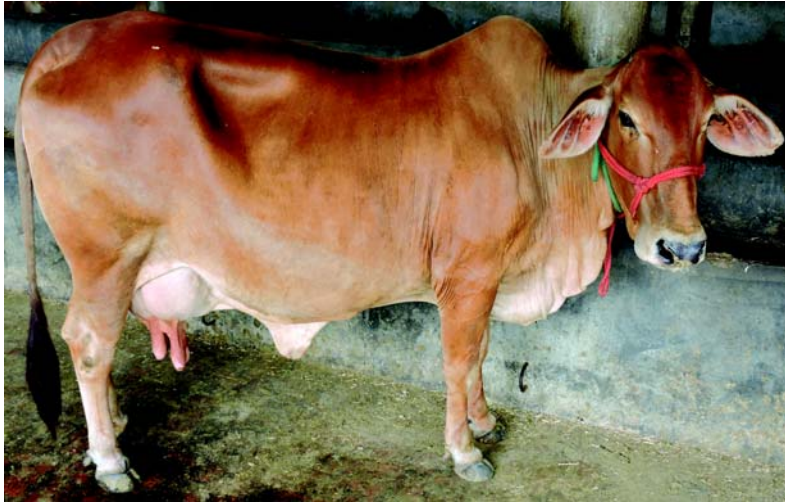
चित्र 1.3 साहीवाल गाय