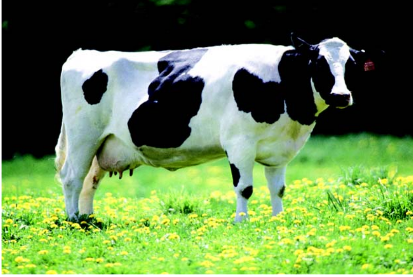
चित्र 1.4 होलिस्टीन गाय