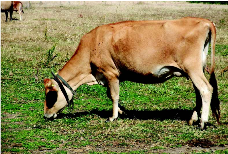
चित्र 1.5 जर्सी गाय