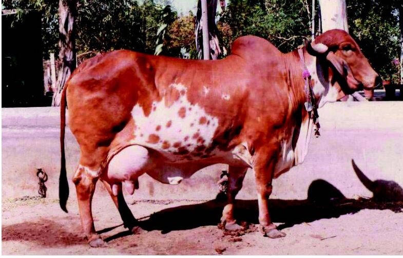
चित्र 1.2 गीर गाय

के लिए अन्य राज्यों में भी ये मिलती हैं। यह अपने लंबे और चौड़े सींगों से आसानी से पहचानी जा सकती है। यह भोडाली, गुजराती, काठियावाड़ी आदि अन्य नामों से भी जानी जाती है।