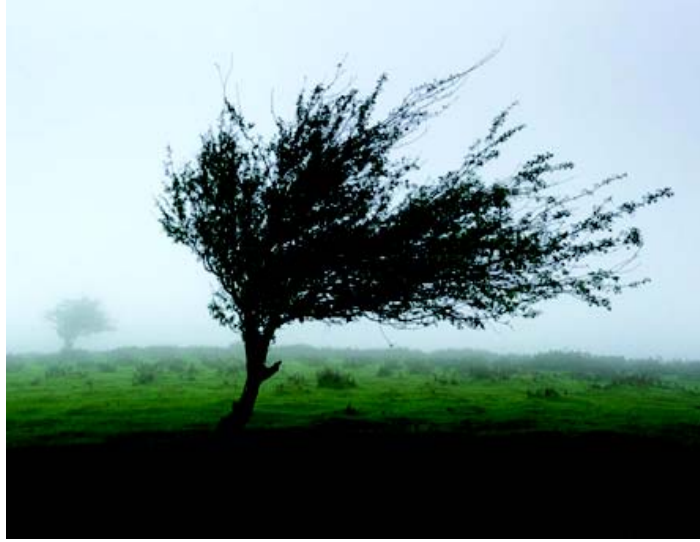
चित्र 8.1 प्राणवायु

इस तरह हम देखते हैं कि आक्सीजन को वेदों में प्राणवायु कहा गया है तथा आदेशित किया गया है कि हमें वायु संरक्षण अर्थात् वायु को शुद्ध रूप में बनाये रखने का प्रयास करते रहना चाहिए। हमें वायु को प्रदूषित नहीं करना चाहिए और जो भी कोई ऐसा वायु प्रदूषित करता है तो उसका अपराध अक्षम्य है।