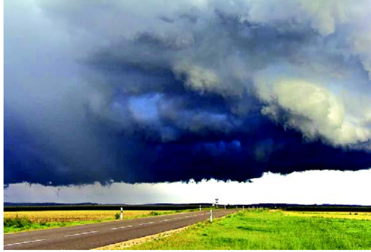
चित्र 8.1 वायु द्वारा आकाशीय जल का संरक्षण

अर्थात् जो वायु सींचने वाले जल को अनेक प्रकार से यहाँ-वहाँ पहुँचाते हैं, जो इसको अन्नादि औषधियों तक ले जाते हैं, छूने योग्य पदार्थों तथा आकाश को नापने वाले उन वायु देवताओं को मैं सम्मुख रखता हूँ। ऐसे वायु देवता हमें सभी कष्टों से मुक्ति दिलावें।