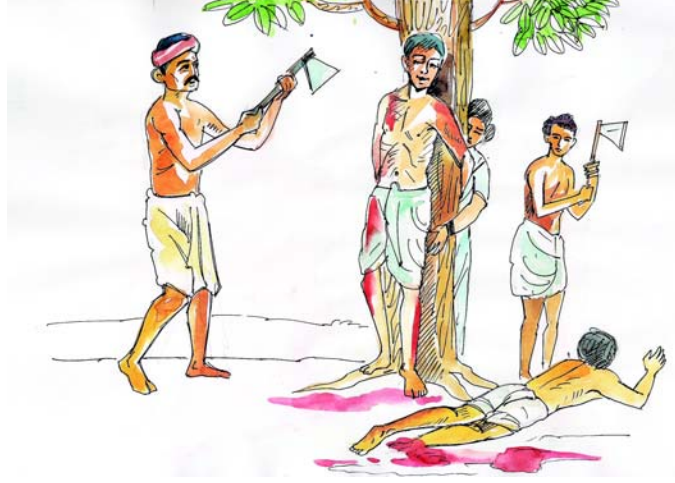
चित्र 4.3 वन संरक्षण सर्वस्व बलिदान

तक बनाये रखते हुए तेरे लिए बलिदान देने लायक बने रहें। यहाँ पर ऋषि पृथ्वी के संरक्षण के लिए अपना बलिदान तक देने की बात कहता है-