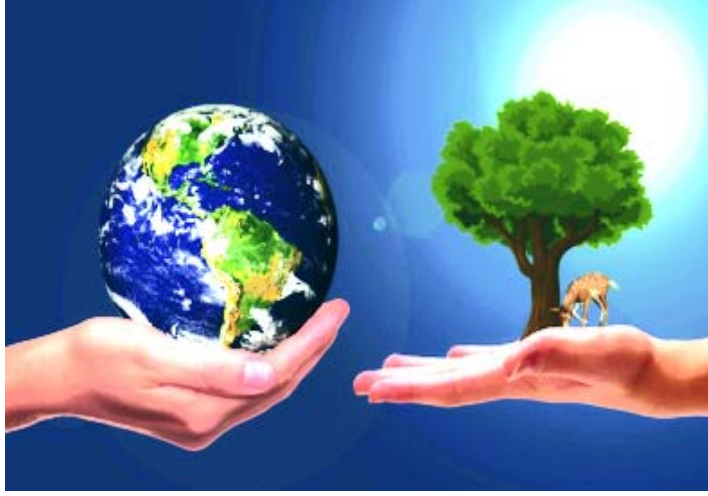
चित्र 4.2 भूमि संरक्षण

यहाँ पर ऋषि पृथ्वी के विभिन्न रूपों के संरक्षण की कामना करता है।