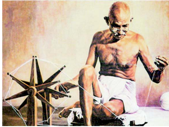
चित्र 4.4 राष्ट्रपिता महात्मा गांधी

महात्मा गांधी जी ने भी कहा था कि यह प्रकृति हमारी आवश्यकताओं को पूर्ण करने में तो समर्थ है परन्तु किसी के लालच को पूर्ण करने में नहीं। यहां पर गांधी जी प्रकृति के अतिदोहन को रोके जाने की और संकेत देते हैं तथा कहते हैं कि प्रकृति का समावेशी संरक्षण करते हुए उपयोग किया जाये तो मनुष्य जाति की सभी जरूरतें पूरी हो सकती हैं।