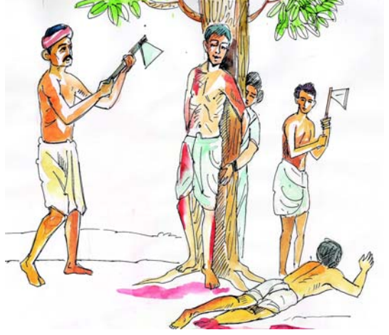
चित्रम् 4.3 वनसंरक्षणार्थस्वबलिदानम्

पृथ्वेः संरक्षणाय अथर्ववेदस्य ऋषिः चिन्तां व्यक्तं करोति तथा कथयति यत् हे पृथ्वी ! तवाङ्के वयं निरोगिणः भवेम । स्वधातुं दीर्घकालपर्यन्तं रक्षणार्थं तव कृते बलिदानप्रदा भवेम । अत्र ऋषिः पृथ्वीं संरक्षणार्थं स्वबलिदानस्य वार्ता कथयति ।