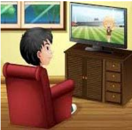
बालकः दूरदर्शनं दृष्टवान् ।