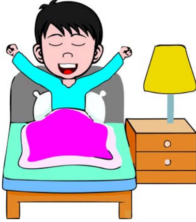
बालकः प्रातः उत्थितवान् ।