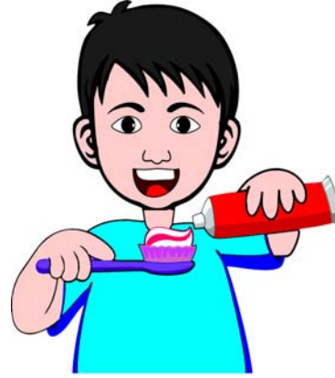
बालकः दन्तधावनं कृतवान् ।