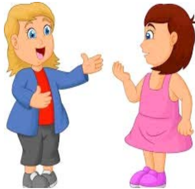
बालिका मित्रं उक्तवती ।