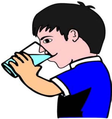
बालकः जलं पीतवान् ।