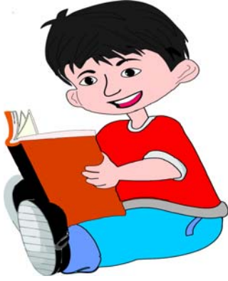
छात्रः पठितवान् ।