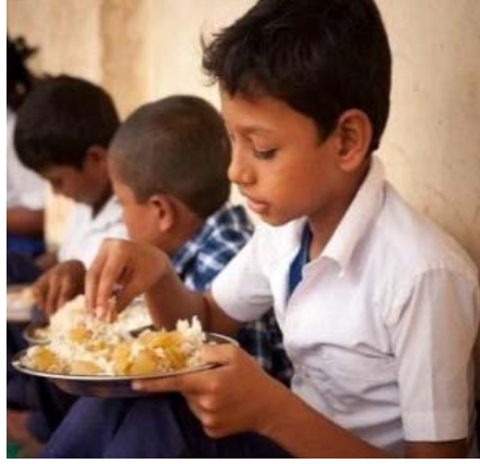
छात्रः अन्नं खादितवान् ।