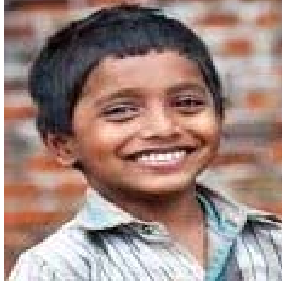
बालकः हसितवान् ।