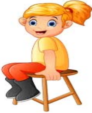
बालिका उपविष्टवती ।