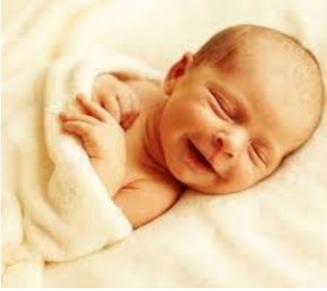
बालः निद्रां कृतवान् ।