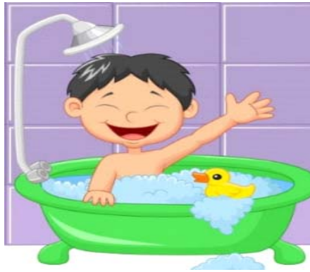
बालकः स्नानं कृतवान् ।