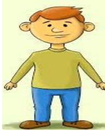
बालकः स्थितवान् ।