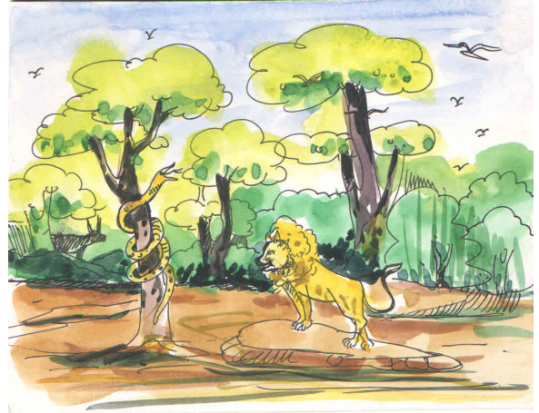
चित्र 6.6: बाघ आदि जानवर एक साथ

व्याख्या : जंगल और पहाड़ एक दूसरे के पूरक होते हैं। इन जंगलों की ओट में पहाड़ों की समानान्तर कई पंक्तियाँ फैली हुई हैं। इसीलिए सतपुड़ा के इस जंगल को “सात-सात पहाड़ वाले” कहा गया है। यानी वनस्पति के साथ पहाड़ का यह संगम इसे दुर्लभ बनाता है। पहाड़ों की इन श्रृंखलाओं में सिंह की उपस्थिति हमारे