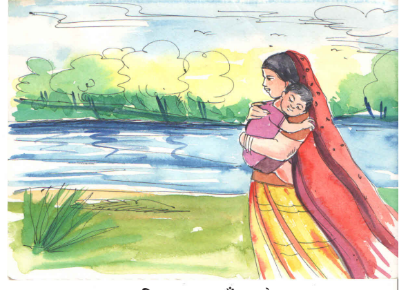
चित्र 6.4: माँ-बच्चे

कविता में जैसे नदी- माँ और संस्कृति तथा द्वीप- पुत्र और व्यक्तित्व के प्रतीक हैं, वैसे ही भूखंड-पिता और समाज के प्रतीक हैं। कविता में कवि ने माँ, पिता और पुत्र का एक पारिवारिक रूपक लिया है। जैसे माँ शिशु को जन्म देकर उसका पालन-पोषण करती है और उसका परिचय पिता से कराती है उसी प्रकार नदी भी द्वीप का निर्माण करती है और उसे विस्तृत भूखंड से मिलाती है। जैसे पुत्र से पिता का संबंध जैविक होता है उसे पालने का प्राथमिक दायित्व माँ का ही होता है। वैसे ही द्वीप भले ही विस्तृत भू-खंड का अंश होता है लेकिन उसे द्वीप के रूप में निर्मित करने का भार नदी ही उठाती है। भूखंड द्वीप का निर्माण नहीं कर सकते हैं। इस कविता में नदी, द्वीप और भू-खंड के प्रतीक का एक और स्तर है। इसे भी यहाँ समझ लेना आवश्यक है। जिस प्रकार नदी, द्वीप का निर्माण करती है और उसे विस्तृत भू-खंड से जोड़ती है, उसी प्रकार संस्कृति, व्यक्तित्व का निर्माण करती है और उसे समाज से जोड़ती है।