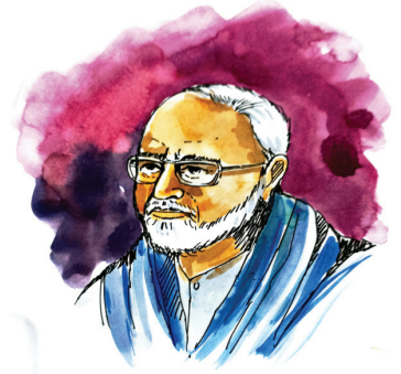
चित्र 6.1: अज्ञेय

नदी, तुम बहती चलो। भूखंड से जो दाय हम को मिला है, मिलता रहा है,