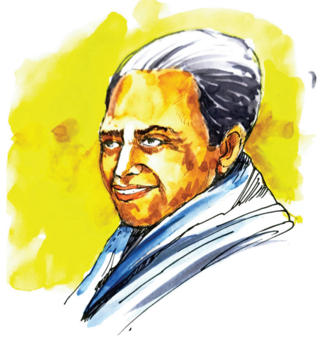
चित्र 6.5: भवानी प्रसाद मिश्र

आपने दसवीं कक्षा में प्रकृति-सौंदर्य और प्रकृति के दोहन की समस्या आधारित कविताएँ पढ़ी हैं। इसी प्रकार अनेक कवियों ने प्रकृति के विभिन्न रूपों को कविता का विषय बनाया; जैसे—सुमित्रानंदन पंत, जयशंकर प्रसाद आदि। भवानीप्रसाद मिश्र का नाम सुनते ही परंपरा में मिट्टी की सोंधी खुशबू और प्रकृति की हरियाली बरबस आँखों में बस जाती है। मिश्रजी की कविताओं को पढ़कर लगता है कि उनका जीवन प्रकृति के काफी करीब रहा है। आइए, पढ़ते हैं उनकी कविता 'सतपुड़ा के घने जंगल' जिसे पढ़कर मन में हरे-भरे जंगल की छवि आँखों के सामने जीवंत हो जाती है।