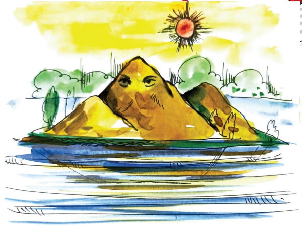
चित्र 6.2: नदी के द्वीप

तुम बढ़ो, प्लावन तुम्हारा घरघराता उठे, यह स्रोतस्विनी ही कर्मनाशा कीर्तिनाशा घोर काल-प्रवाहिनी बन जाय तो हमें स्वीकार है वह भी। उसी में रेत होकर फिर छनेंगे हम। जमेंगे हम। कहीं फिर पैर टेकेंगे। कहीं फिर भी खड़ा होगा नये व्यक्तित्व का आकार। मातः, उसे फिर संस्कार तुम देना।