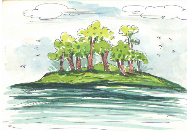
चित्र 6.3: वृक्ष और नदी

आपने देखा होगा कि नदी के बीच में रेत का थोड़ा उभरा हुआ हिस्सा, जो द्वीप के रूप में दिखाई देता है, वह नदी के दोनों किनारों पर दूर तक फैली हुई भूमि से भी जुड़ा होता है। कवि संकेत करता है कि नदी रूप-आकार देकर द्वीप को निर्मित ही नहीं करती है बल्कि उसे उस विस्तृत भू-खंड से भी मिलाने का भी काम करती है जिसका वह अटूट अंश है। इस